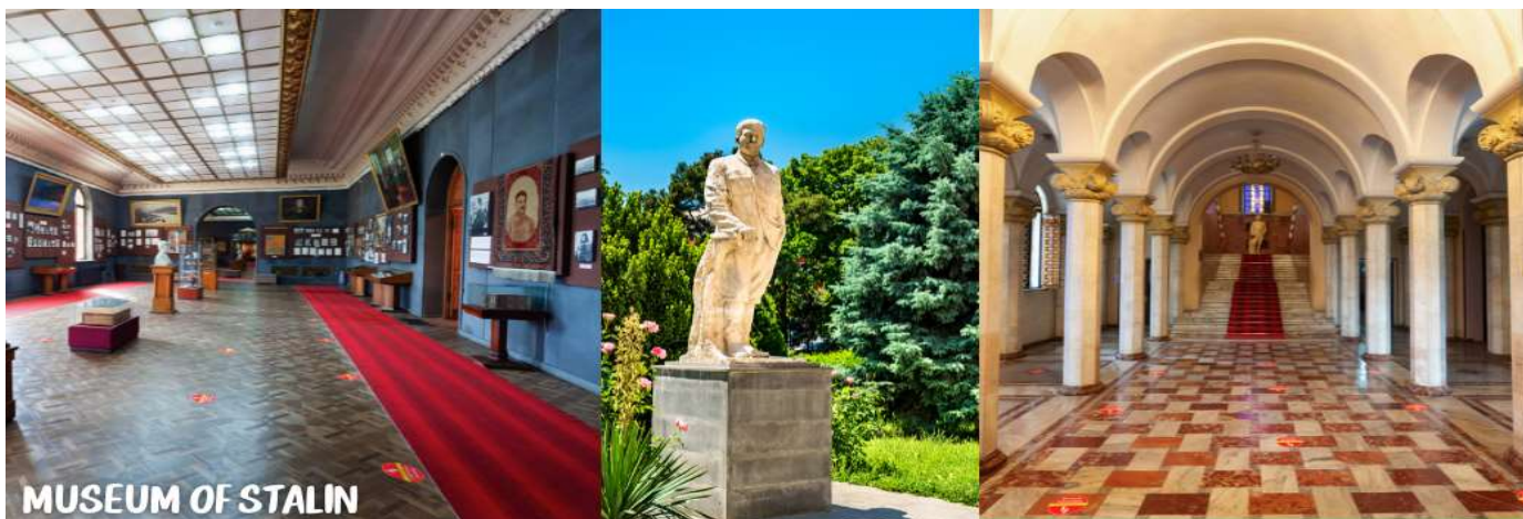
MUSEUM OF STALIN

นำท่านออกเดินทางสู่เมือง KUTAISI เป็นเมืองเล็กๆที่อยู่ระหว่างเมืองท่องเที่ยว UPLOSTSIKHE หรือ GORI และเมือง MESTIA (ใช้เวลาเดินทางประมาณ 2.30 ชม.)