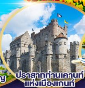
ปราสาทท่านเคานท์แห่งเมืองเกนท์