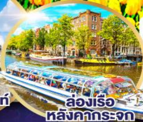
ล่องเรือหลังคากะจก