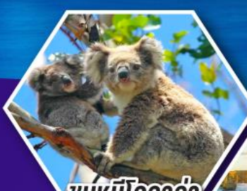
ชมหมีโคอาล่า ณ สวนสัตว์ซิดนีย์