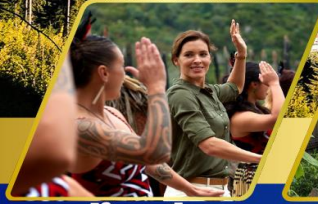
หมู่บ้านเมารี อาหารสไตล์ชาวเมารี แบบแท้จริง