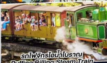
รถไฟจักรไอน้ำโบราณ Puffing Billing Steam Train