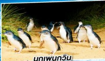
นกเพนกวิน