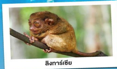
ลิงทาร์เซีย