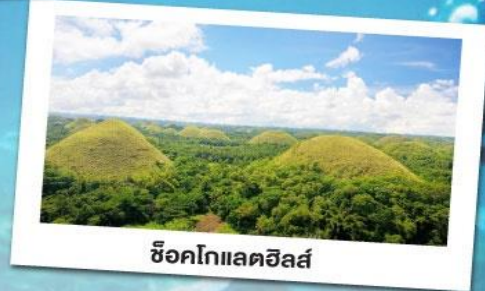
ช็อคโกแลตฮิลล์