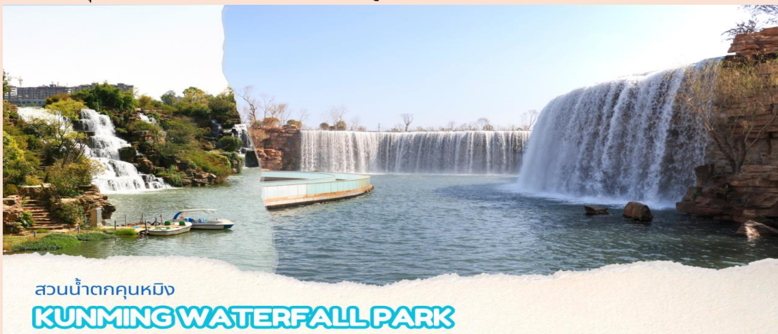
สวนน้ำตกคุนหมิง KUNMING WATERFALL PARK