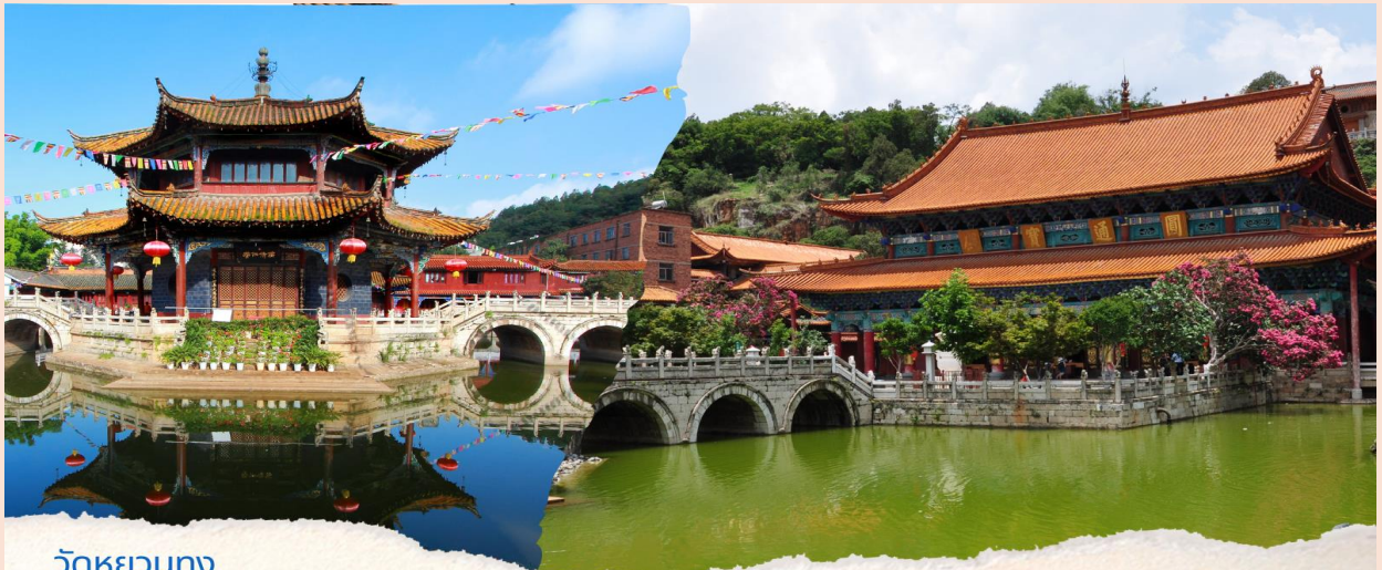
วัดหยวนทอง

เดินทางสู่ วัดหยวนทอง (Yuan tong Temple) เป็นวัดที่ใหญ่และเก่าแก่ที่สุดของมณฑลยูนนาน ตั้งอยู่ที่ถนนหยวนทองเจียง สร้างมาตั้งแต่สมัยราชวงศ์ถังมีอายุยาวนานประมาณ 1,200 กว่าปี ภายในวัดตกแต่งร่มรื่นสวยงาม กลางลานมีสระน้ำขนาดใหญ่ แต่การสร้างวัดแห่งนี้ดูแล้วจะแปลกตากว่าวัดอื่นๆ ในจีน เพราะปกติแล้วการสร้างวัดของจีนส่วนมากจะต้องสร้างอยู่บนภูเขา มีแต่วัดหยวนทองที่สร้างแปลกที่สุดในจีนคือสร้างวัดต่ำกว่าภูเขา โดยวิหารจะอยู่ต่ำที่สุด เนื่องจากวัดแห่งนี้ ไม่ได้สร้างขึ้นเพื่อเป็นวัดโดยตรง แต่เคยเป็นศาลเจ้าแม่กวนอิมมาก่อน ดังนั้นคำว่า “หยวนทอง” จึงเป็นชื่อที่ปรากฏในคัมภีร์ของเจ้าแม่กวนอิม มีสะพานข้ามไปสู่ศาลาแปดเหลี่ยมกลางสระน้ำมรกต มีทั้งปลา, เต่าอยู่มากมาย ศาลาหลังนี้สร้างขึ้นในสมัยราชวงศ์ชิง ในศาลาประดิษฐาน “เจ้าแม่กวนอิมพันกร” และเจ้าแม่กวนอิมพม่า หรือเรียกว่า “เจ้าแม่กวนอิมหยก”