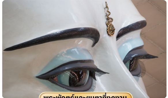
พระพักตร์และขนตาที่งดงาม

จากนั้นนำท่านสู่ วัดพระเจดีย์พระเจ้ากัณฑ์ นำท่านนมัสการพระประธานในวัด ซึ่งเป็นพระพุทธรูปนั่งปางมารวิชัยสีขาว ทรงเครื่องแบบพม่า มีขนาดสูงใหญ่มาๆ ประดิษฐานอยู่ในวิหารที่มองจากด้านนอกจะเห็นหลังคาข้างบนคล้ายเจดีย์ทรงสี่เหลี่ยมขาวพม่าศรัทธา พระพุทธรูปองค์นี้อย่างมาก ในแต่ละวันจะเห็นคนมานั่ง ทำสมาธิด้านหน้าองค์พระ คนที่มา ที่วัดนี้ส่วนมากจะเป็นชาวพม่าหรือชาวไทยใหญ่ และคนที่เดินทางมาจากรัฐฉาน วัดพระเจดีย์พระเจ้ากัณฑ์ เวลาออกเสียงจะได้ยินชาวพม่าออกเสียงเร็วๆ คล้ายๆ คำว่าจาทะจี