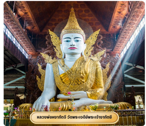
หลวงพ่อหยกแก้ว วัดพระเจดีย์พระเจ้ากัณฑ์

จากนั้นนำท่านสู่ วัดพระเจดีย์พระเจ้ากัณฑ์ นำท่านนมัสการพระประธานในวัด ซึ่งเป็นพระพุทธรูปนั่งปางมารวิชัยสีขาว ทรงเครื่องแบบพม่า มีขนาดสูงใหญ่มาๆ ประดิษฐานอยู่ในวิหารที่มองจากด้านนอกจะเห็นหลังคาข้างบนคล้ายเจดีย์ทรงสี่เหลี่ยมขาวพม่าศรัทธา พระพุทธรูปองค์นี้อย่างมาก ในแต่ละวันจะเห็นคนมานั่ง ทำสมาธิด้านหน้าองค์พระ คนที่มา ที่วัดนี้ส่วนมากจะเป็นชาวพม่าหรือชาวไทยใหญ่ และคนที่เดินทางมาจากรัฐฉาน วัดพระเจดีย์พระเจ้ากัณฑ์ เวลาออกเสียงจะได้ยินชาวพม่าออกเสียงเร็วๆ คล้ายๆ คำว่าจาทะจี