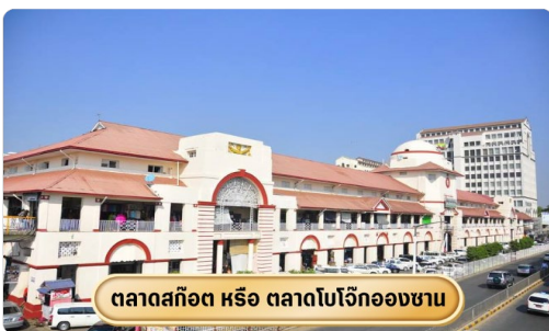
ตลาดสก๊อต หรือ ตลาดโบโจ๊กอองซาน

จากนั้นนำท่านช้อปปิ้ง สินค้าของฝากที่ ตลาดสก๊อต หรือเรียกอีกอย่างว่า ตลาดโบ-ยก อองซาน เป็นตลาดสำคัญของเมืองย่างกุ้ง โดยของขึ้นชื่อที่ตลาดแห่งนี้คือ "หยกพม่า" ซึ่งได้รับความนิยมจากนักท่องเที่ยวเป็นอย่างมาก นอกจากนี้ยังเป็นตลาดที่มีสินค้าหลากหลายชนิดให้เลือกซื้อ ทั้งข้าวของเครื่องใช้ ของฝากของที่ระลึก เสื้อผ้า ไปจนถึงอาหาร