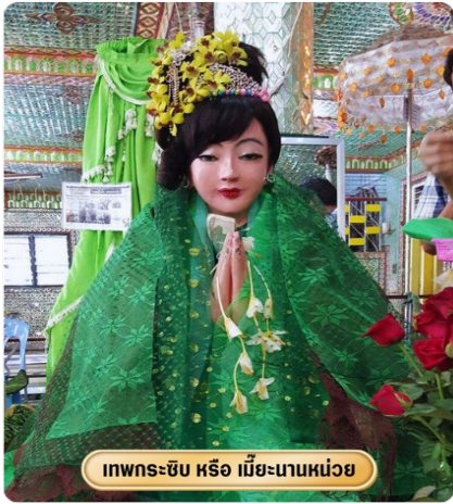
เทพกระซิบ หรือ เมียะนานหน่วย