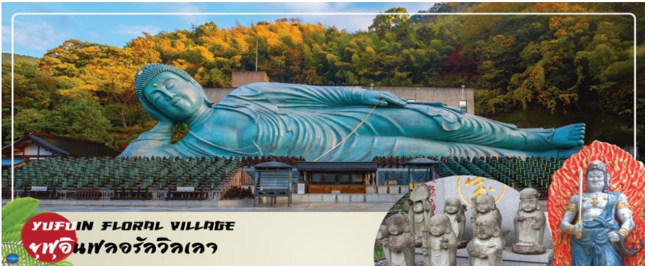
YUFUIN FLORAL VILLAGE ฟูฟุอินฟลอรัลวิลเลจ

เลือกรับประทานอาหารกลางวัน ณ หมู่บ้านยูฟุอินตามอัตราค่า (3) Cash Back ท่านละ 1000 เยน (จ่ายโดยไกด์หน้างาน)