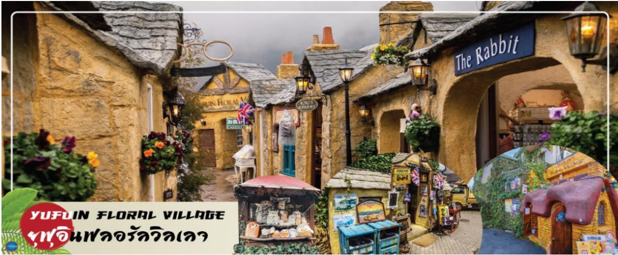
YUFUIN FLORAL VILLAGE ฟูฟุอินฟลอรัลวิลเลจ