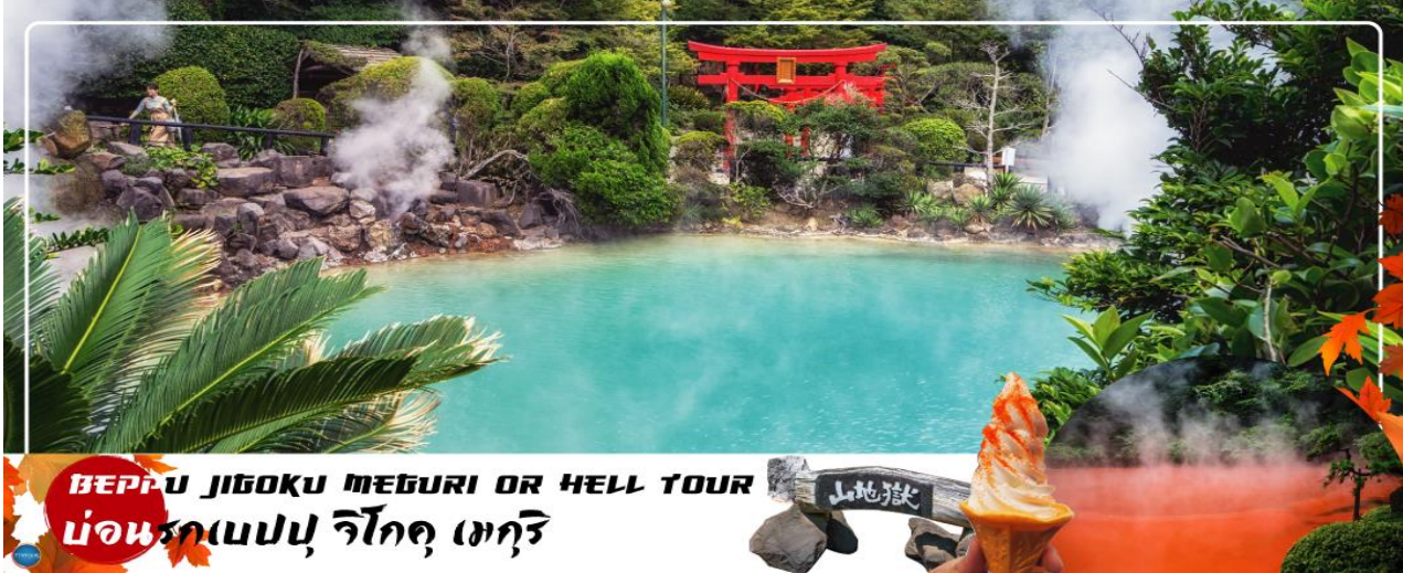
BEPPU JIGOKU MEGURI OR HELL TOUR บ่อนรกเบปปุ จิโกกุ เมกูริ

วันที่สาม เมืองเบปปุ – บ่อนรกเบปปุ จิโกกุ เมกูริ (เข้าชม 2 บ่อ) – เมืองยุฟุอิน – หมู่บ้านยุฟุอินฟลอรัล – ทะเลสาบคิริน – เมืองฟุกุโอกะ – วัดนันโชอิน – ดิวด์์ฟรี – กันดั้ม ปาร์ค ฟุกุโอกะ