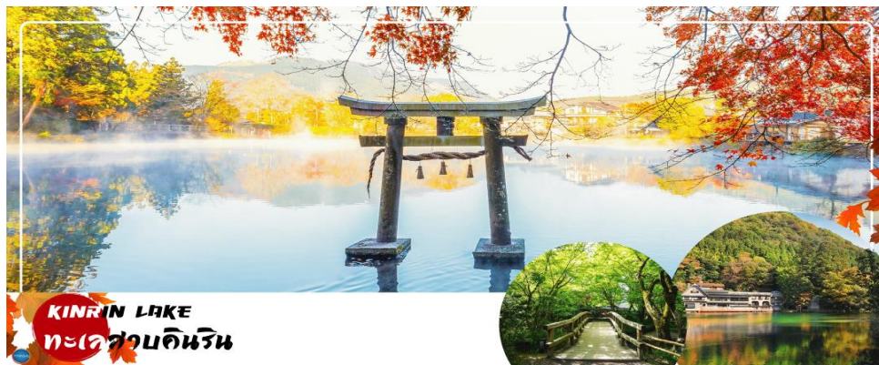
KIRIN LAKE ทะเลสาบคิริน