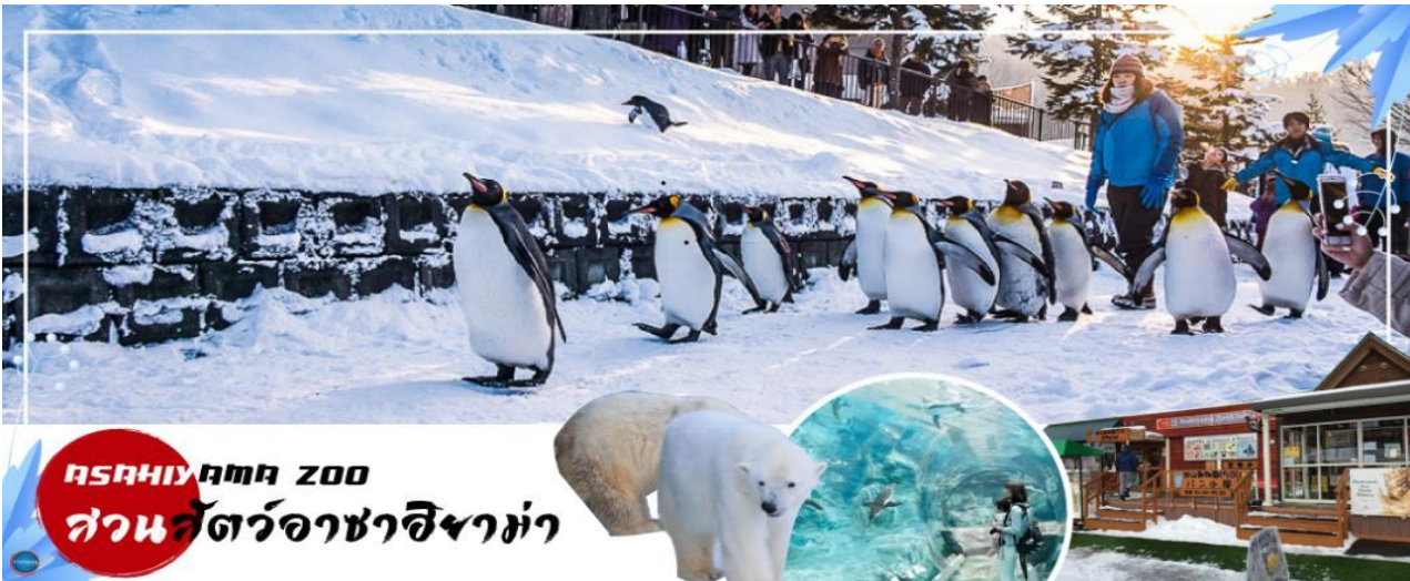
Asahiyama Zoo สวนสัตว์อาซาฮิยาม่า

วันที่สี่ เมืองอาซาฮิกาวา – สวนสัตว์อะซาฮิยาม่า – หมู่บ้านราเมงอะซาฮิยาม่า – เมืองฟูราโนะ – ลานสนิ่ว เวิลด์ (กิจกรรมทางหิมะ) – เมืองซัปโปโร – ย่านซูซุกิโนะ