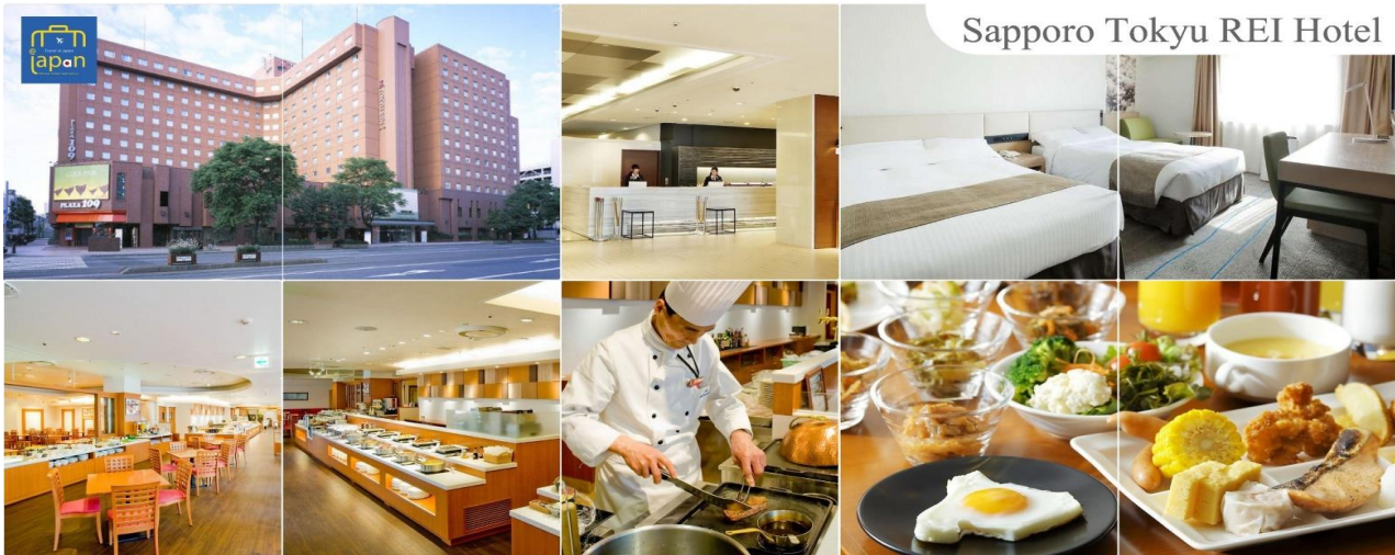
Sapporo Tokyu REI Hotel

เป็น ร้านซุซุกิโนะ รับประทานอาหารเย็น ณ ภัตตาคาร (6) --- พิเศษ!!! เมนู ซาซุ + ซาซุ SAPPORO TOKYU REI HOTEL หรือเทียบเท่าระดับเดียวกัน