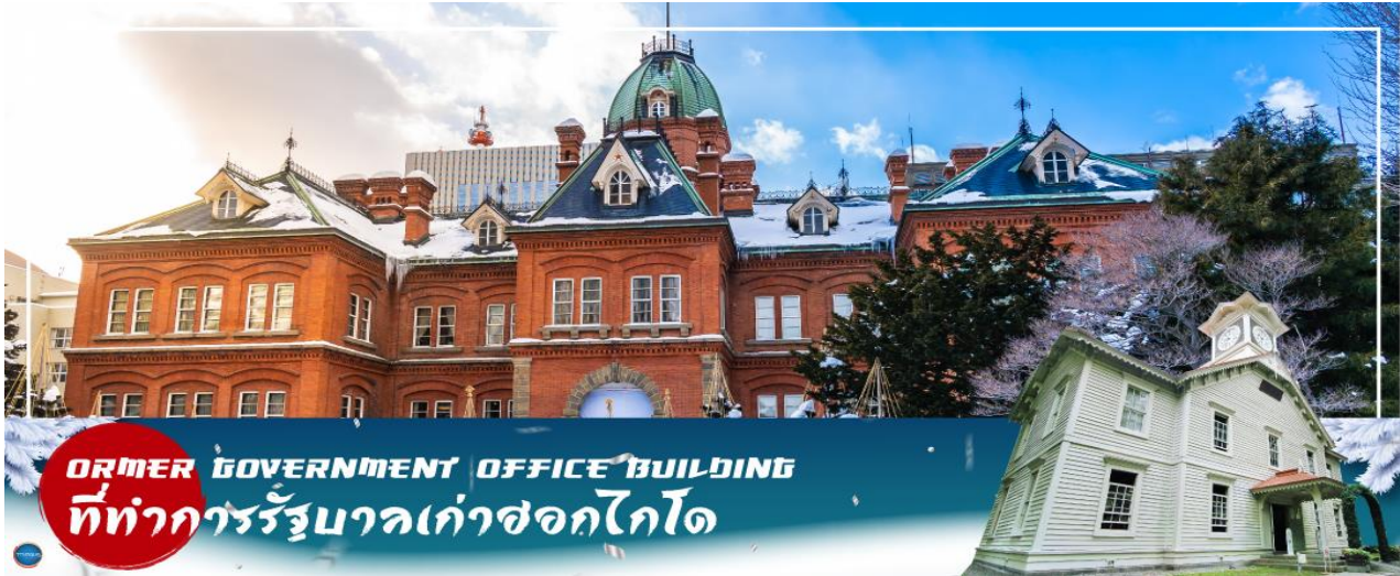
FORMER GOVERNMENT OFFICE BUILDING ที่ทำการรัฐบาลเก่าฮอกไกโด

เข้าชม พิพิธภัณฑ์กล่องดนตรี (Music Box Museum) พิพิธภัณฑ์กล่องดนตรีโอตารุเป็น หนึ่งในร้านค้าที่ใหญ่ที่สุดของพิพิธภัณฑ์กล่องดนตรีในญี่ปุ่น โดยตัวอาคารมีความเก่าแก่สวยงามและถือเป็นอีกหนึ่งในสถานที่สำคัญทางประวัติศาสตร์เมือง 'ไฮไลต์!!! หน้าอาคารหลักของพิพิธภัณฑ์กล่องดนตรี มี นาฬิกาไอน้ำ (Steam Clock) ปัจจุบันมีเพียง 2 เรือนในโลกคือที่เมืองแวนคูเวอร์ ประเทศแคนาดา กับที่เมืองโอตารุแห่งนี้ นาฬิกาจะเล่นเพลงและปล่อยไอน้ำออกมาทุกๆ 15 นาที ถือเป็นจุดแลนด์มาร์คอีกหนึ่งจุดที่มาโอตารุแล้วไม่ควรพลาด นอกจากสถานที่ดังกล่าวข้างต้นนั้น ยังมีร้านขนมและร้านขายสินค้าที่ระลึกอีกมากมาย เช่น ร้านขนม LeTAO ที่ภายในนอกจากจะจำหน่ายขนมแล้วยังเป็นร้านกาแฟ ที่หากท่านเดินช้อปปิ้งมาเหนื่อยๆ สามารถแวะมาพักผ่อนจิบเครื่องดื่มพร้อมชิมขนมหวาน ณ ร้านนี้ได้ ร้าน Rokkatei โกดัง โรงงานผลิตขนมของฮอกไกโด ด้านในมีจำหน่ายขนมมมเนย รวมไปถึง กาแฟ และของฝากของขึ้นชื่อของเมืองโอตารุ อีกทั้งสามารถซื้อสินค้าแบบ Tax Free ได้ด้วย และข้างๆกันยังมี ร้าน Kitakaro โกดังผลิตขนมอีกรายหนึ่ง ร้านนี้เน้นในส่วน ของขนมสด อาทิ ชอฟฟครีม เค้กต้นไม้ และขนมอบต่างๆ เป็นต้น อิสระให้ท่านเดินเล่นถนนซาไกมาจิตตามอัธยาศัย