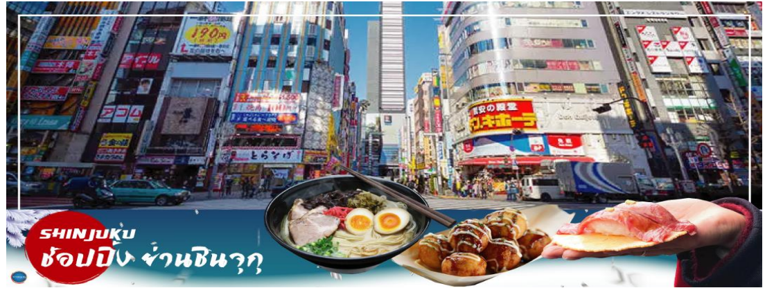
SHINJUKU ช้อปปิ้ง ย่านชินจูกุ