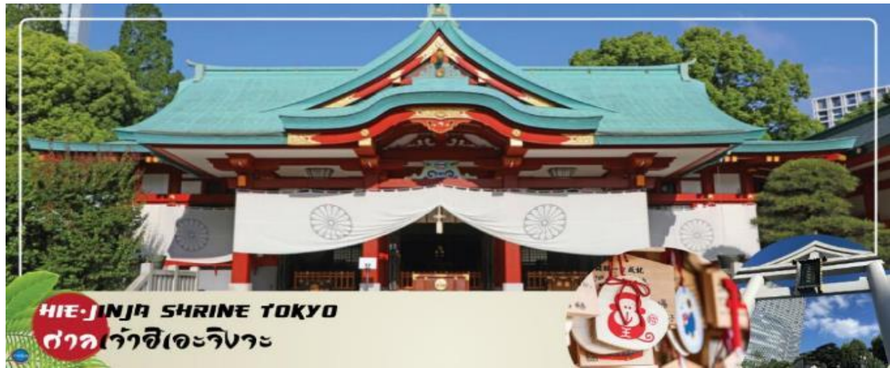
HIE-JINJA SHRINE TOKYO

เมืองนาริตะ – กรุงโตเกียว – ศาลเจ้าอิเอะ – พระราชวังอิมพีเรียล (ด้านนอก) – สะพานแวนดา – ยานโอโดมะ – ห้างไดเวอร์ซิตี – ท่าอากาศยานนานาชาตินาริตะ