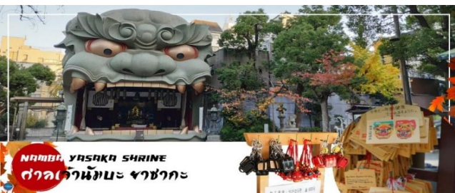
NAMBA YASAKA SHRINE ศาลเจ้านัมมะ ยาซากะ

นำทุกท่านเช็คอินจุดถ่ายรูปที่ ศาลเจ้านัมมะยาซากะ (Namba Yasaka Shrine) ตั้งอยู่ในย่านนัมมะของเมืองโอซาก้า ไฮไลท์ของศาลเจ้าแห่งนี้ คือรูปปั้นหน้าสิงโตอ้าปากขนาดใหญ่ ที่เชื่อกันว่า สามารถกลืนกินปีศาจร้าย หรือ สิ่งไม่ดีทั้งหลายให้หายไป และนำพามาซึ่งความโชคดีให้แก่ผู้คน ปัจจุบันนักเรียน นักศึกษาและผู้ประกอบการธุรกิจนั้น นิยมมาขอพรให้ประสบความสำเร็จกันที่นี่ ด้วยความสูง 17 เมตร ความกว้าง 11 เมตรและความลึก 7 เมตร อีสระให้ทุกท่านสักการะ และเก็บภาพที่ ศาลเจ้านัมมะ ยะซะกะ