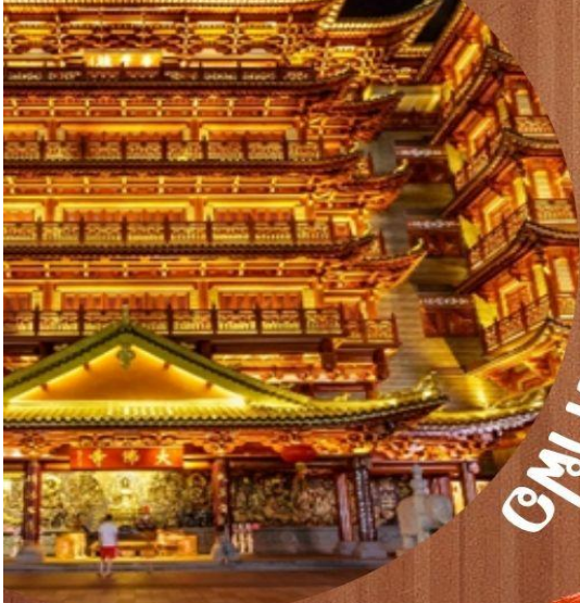
มณฑลไต้หวัน