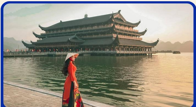
จุดเช็คอินแห่งใหม่ "วัดตามจึก"