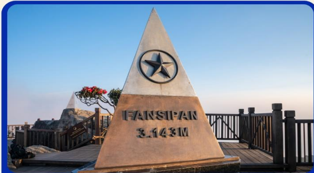
นั่งกระเช้าสู่อยอดเขาฟานซิปัน