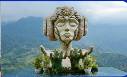
เชคอิน โมอาน่า (Moana Sapa Cafe)