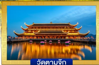
วัดตามจุก