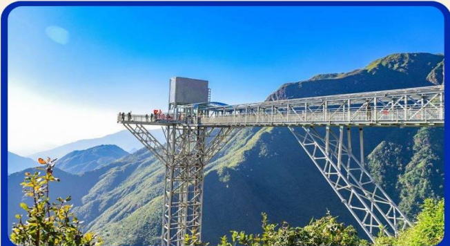
สะพานแก้วมังกรเมฆ (Rong May Glass Bridge)