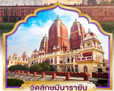
วัดลักษมีนารายณ์