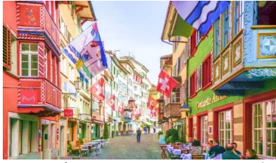
เที่ยง อีสรอาหารกลางวัน เพื่อไม่ให้เป็นการเสียเวลาในการช้อปปิ้ง

นำท่านสู่ ถนนบานโฮฟชตราสเซอ(Bahnhofstrasse) เป็นย่านธุรกิจการค้าสำคัญของเมือง มีความยาวประมาณ 1.4 กิโลเมตร เป็นถนนที่เป็นที่รู้จักในระดับนานาชาติว่าเป็น ถนนช้อปปิ้งที่มีสินค้าราคาแพงที่สุดแห่งหนึ่งของโลก ตลอดสองข้างทางล้วนแล้วแต่เป็นที่ตั้งของห้างสรรพสินค้า ร้านค้าอัญมณี ร้านเครื่องประดับ ร้านนาฬิกาและโรงแรมระดับหรู ถัดจากถนนบานโฮฟชตราสเซอ คือ ถนนออกัสตินเนอร์กาส(Augustinergasse) ถนนเก่าแก่สายเล็กๆ ที่มีมาตั้งแต่สมัยยุคกลาง ตลอดสองข้างทางเป็นที่ตั้งของอาคารบ้านเรือนที่มีหน้าต่างไม้แกะสลัก สร้างขึ้นจากช่างฝีมือในยุคกลาง