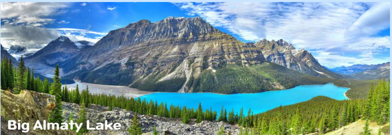
Big Almaty Lake

เช้า รับประทานอาหารเช้า ณ ห้องอาหารโรงแรม