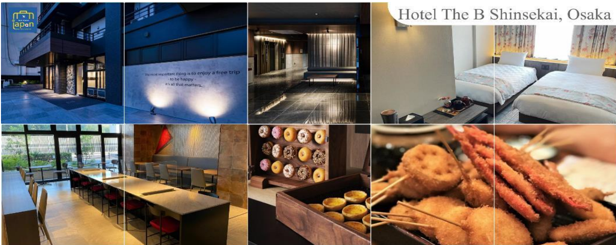
Hotel The B Shinsekai, Osaka

พักที่ HOTEL THE B SHINSEKAI, OSAKA หรือเทียบเท่าระดับเดียวกัน