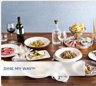
DINE MY WAY SM