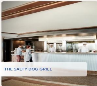
THE SALTY DOG GRILL