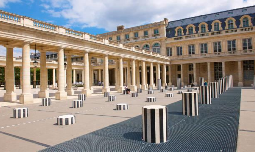
FMS-OSCDG001 F-CH-I8D5N, OS APR-MAY2024