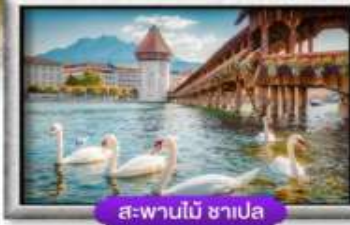
สะพานไม้ ซาเปล