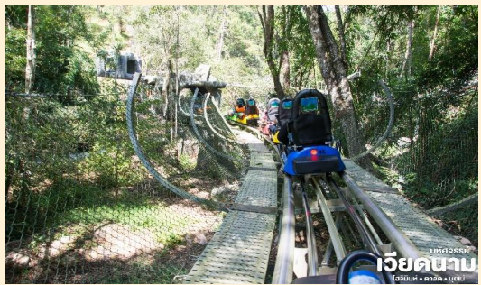
มหัศจรรย์ เวียดนาม โฮจิมินห์ • ดาลัด • มุยเน่

นำท่าน เดินทางสู่ น้ำตกDATANLA ซึ่งเป็นน้ำตกที่ขนาดใหญ่แต่สวยงาม และ สนุกสนานกับกิจกรรมสุดพิเศษ!! ทุกท่านจะได้นั่ง ROLLER COASTER ลงไปชมน้ำตกท่านจะได้รับประสบการณ์แปลกใหม่ที่ไม่ควรพลาด