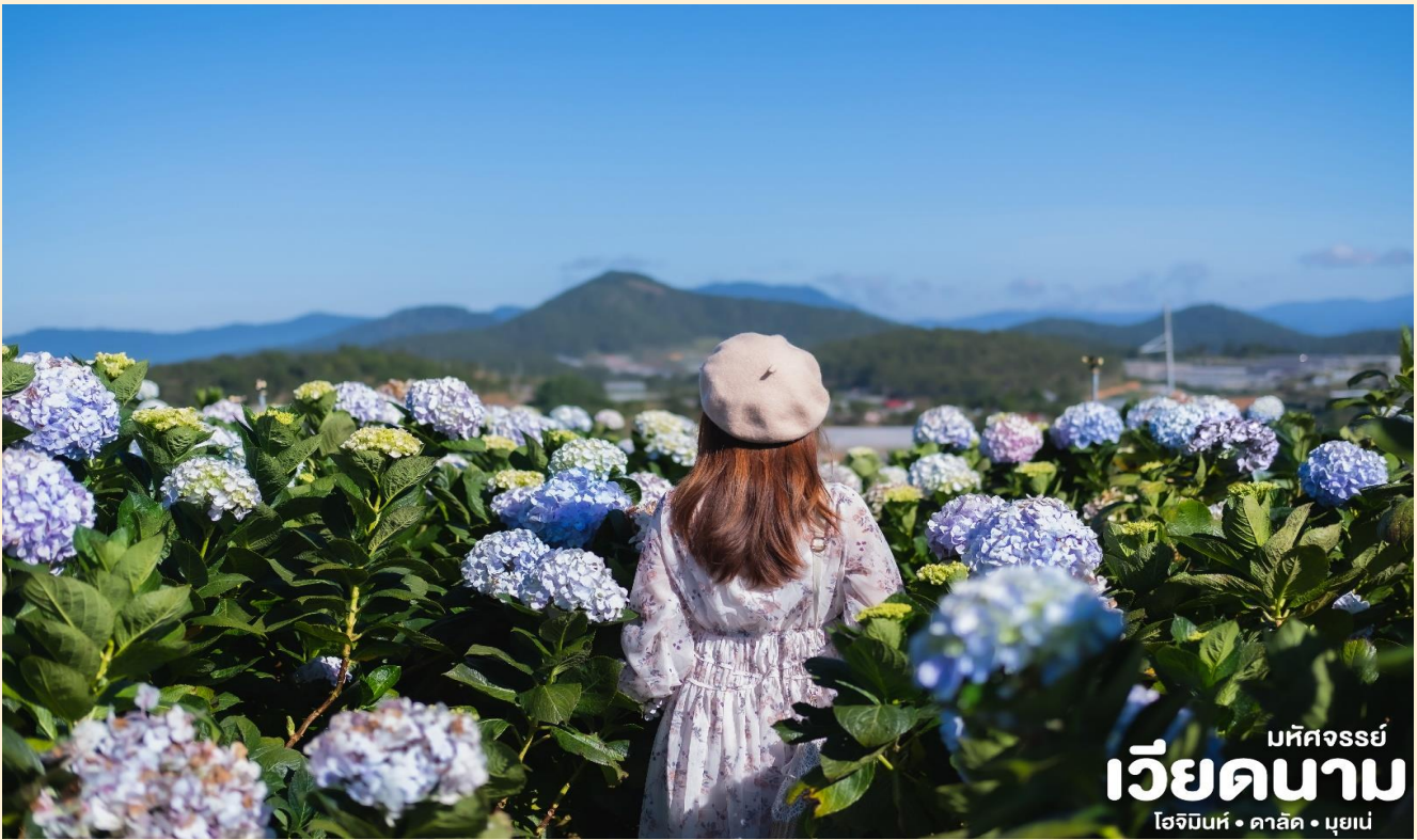
มหัศจรรย์ เวียดนาม โฮจิมินห์ • ดาลัด • มุยเน่

เช้า 10 บริการอาหารเช้า ณ ห้องอาหารโรงแรม จากนั้น นำท่านชมความสวยงามของ สวนดอกไม้ไฮเดรนเยีย ที่เบ่งบานอยู่เต็มพื้นที่ ซึ่งถือว่าสวนไฮเดรนเยียแห่งนี้เป็นที่ท่องเที่ยวอันดับต้นๆที่ดึงดูดนักท่องเที่ยวให้เดินทางมาเยี่ยมชมได้เป็นอย่างดี และให้ท่านเพลิดเพลินเก็บภาพความประทับใจตามอัธยาศัย