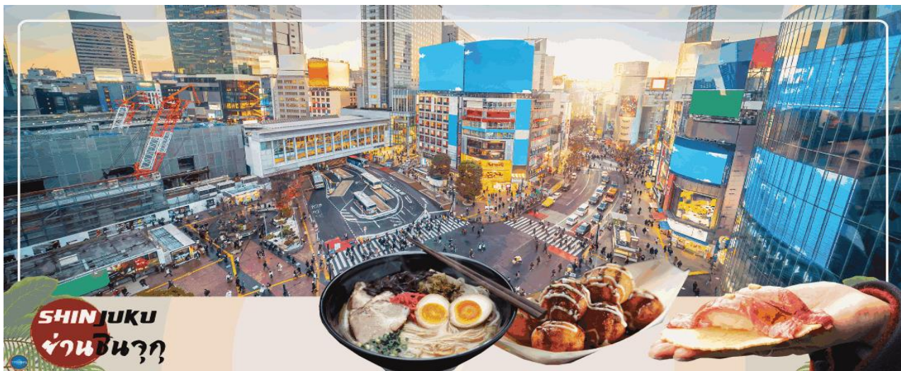
SHINJUKU ย่านชินจูกุ

นำท่านช้อปปิ้ง ย่านชินจูกุ (Shinjuku) ให้ท่านอิสระและเพลิดเพลินกับการช้อปปิ้งสินค้ามากมาย ทั้งเครื่องใช้ไฟฟ้า กล้องถ่ายรูปดีจิตอล นาฬิกา เครื่องเล่นเกม หรือสินค้าที่จะเอาใจคุณผู้หญิงด้วย กระเป๋า รองเท้า เสื้อผ้า แบรินต์เนม เสื้อผ้าแฟชั่นสำหรับวัยรุ่น เครื่องสำอางยี่ห้อดังของญี่ปุ่นไม่ว่าจะเป็น KOSE, KANEBO, SK II, SHISEDO และอื่นๆ อีกมากมาย ห้ามพลาด!!! จุดเช็คอินแห่งใหม่