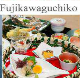
Yukari No Mori Fujikawaguchiko