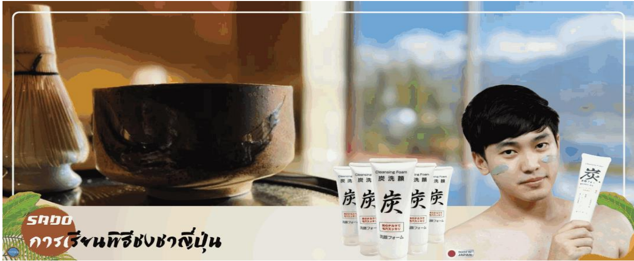
SADO การเรียนรู้พิธีชงชาญี่ปุ่น

วันที่สาม จังหวัดยามานาชิ – การเรียนพิธีชงชาญี่ปุ่น – กรุงโตเกียว – ชมแมวยักษ์ 3 มิติ พร้อมช้อปปิ้ง ย่านชินจูกุ – ย่านโอไดบะ – ห้างไดเวอร์ซิตี – เมืองนาริตะ