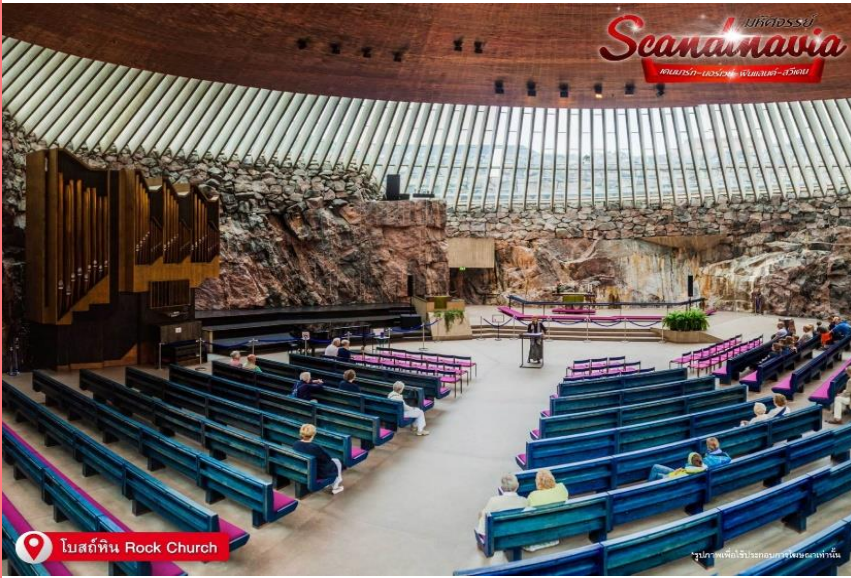
โบสถ์หิน Rock Church

เช้า บริการอาหารเช้า ณ ห้องอาหารของโรงแรม