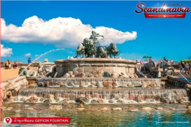
น้ำพุพืชมุน GEFION FOUNTAIN

BT-SNV01_TG SCANDINAVIA 12D9N 22JUL-02AUG24