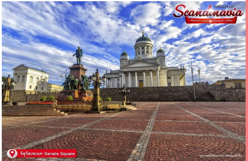
จัตุรัสเซเนท Senate Square

ถ่ายภาพอาคารที่น่าตื่นตาตื่นใจรอบๆ จัตุรัสขนาดใหญ่แห่งนี้ ซึ่งเป็นศูนย์กลางวัฒนธรรมของการเมือง ศาสนาและวิทยาศาสตร์ในเมืองนี้ จัตุรัสขนาดใหญ่เป็นการอุทิศให้การออกแบบสไตล์นีโอคลาสสิกสมัยศตวรรษที่ 19 ด้านหน้าโบสถ์มีรูปปั้นพระเจ้าอเล็กซานเดอร์ที่ 2 ที่บริเวณนั้น หอสมุดแห่งชาติ เฮลซิงกิ (Helsinki Central library) ห น้ า อ า ค า ร ภายนอกสีเหลือง เสาสีขาวและโถงกลมตรงกลางในมุมตะวันออกเฉียงใต้ของจัตุรัสคือบ้านของเซเดร์โฮล์ม ซึ่งเป็นอาคารหินที่เก่าแก่ที่สุดของเมือง