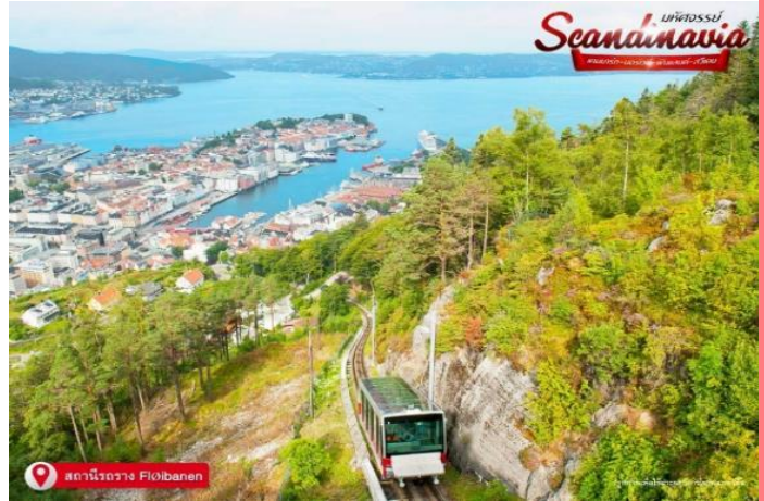
สถานีรกราง Fløibanen

ตัวรกรางกับระบบขนส่งเองให้ดูมีรูปแบบที่ทันสมัยขึ้นตามเวลาด้วย สถานีต้นทางไปด้านบนสุด มีความสูง 320 เมตรเหนือระดับน้ำทะเล รกรางจะออกจากใจกลางเมือง ทุกๆ 15 นาที จะเห็นวิว Mt. Floyen (ฟลอยัน) 1 ใน 7 หุบเขาที่ล้อมรอบเบอร์เกน และ มองลงไปเห็นทิวทัศน์ของเมืองและอ่าวท่าเรือเฟอร์รี่ ที่ียวชม บริกเกิน (Bryggen Hanseatic Wharf) เป็นท่าเรือเก่าของเมืองเบอร์เกน ที่ UNESCO ได้ยกย่องให้เป็นมรดกโลก ด้วยหลักฐานแสดงความสำคัญของเมืองในฐานะส่วนหนึ่งของจักรวรรดิการค้าของสันนิบาตอันเชียดิก ตั้งแต่คริสต์ศตวรรษที่ 14 จนถึงกลางคริสต์ศตวรรษที่ 16 เคยเกิดเพลิงไหม้เผาทำลายบ้านไม้อันสวยงามของบริกเกินมาแล้วหลายครั้งที่นี่มีร้านอาหาร คาเฟ่ ร้านขายของฝาก รวมถึงจุดถ่ายรูปต่างๆ เช่น รูปปั้น Troll แถว Troll Forest Park จากนั้นนั่งรถรางกลับสู่สถานีด้านล่าง