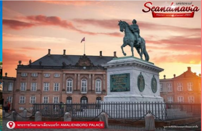
พระราชวังอามาเลียนเบิร์ก AMALIENBORG PALACE

เดินทางสู่ ท่าเรืออนุสาวรีย์ (Nyhavn) เป็นเขตท่าเรืออันเก่าแก่ของโคเปนเฮเกน ตั้งอยู่ริมฝั่งตะวันออกของตัวเมือง ตามประวัติได้กล่าวไว้ว่า พระเจ้าเฟรเดอริกที่ 5 ทรงรับสั่งให้สร้างท่าเรือเล็กๆ ตัวเมืองหลวง เพื่อให้สะดวกต่อการขนย้ายสินค้า และใช้เป็นท่าเรือพาณิชย์สำหรับเรือจากทั่วทุกมุมโลกมาเทียบท่า ในวันอากาศดีๆ สามารถเลือกทานอาหารชมบรรยากาศชิลๆ