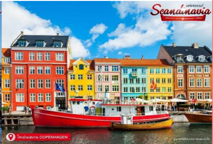
โคเปนเฮเกน COPENHAGEN