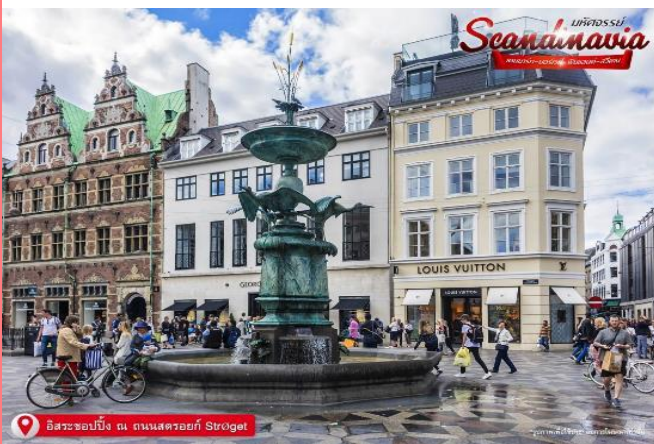
อิสระช้อปปิ้ง ณ ถนนสตรีทรอย์ Strøget

ให้ท่านได้ อิสระช้อปปิ้ง ณ ถนนสตรีทรอย์ (Strøget) ถนนคนเดินที่ยาวที่สุดในโลก ร้านบนถนนช้อปปิ้งสายหลักของเมืองนั้นเต็มไปด้วยแบรนด์ดังที่เราคุ้นเคยดี ตั้งแต่ Louis Vuitton ไปจน Urban Outfitter และ Zara ที่ไม่ว่าใครจะเข้ามาแล้วก็เมืองก็สาขา ก็ไม่สามารถหยุดขาตัวเองไม่ให้เดินเข้าไปซ้ำได้ แต่ที่น่าสนใจมากกว่าคือร้านของแบรนด์ดีไซเนอร์ท้องถิ่นชื่อดัง อย่าง Wood Wood, Stine Goya, Henrik Vibskov ที่ตั้งอยู่บริเวณนี้เช่นกัน