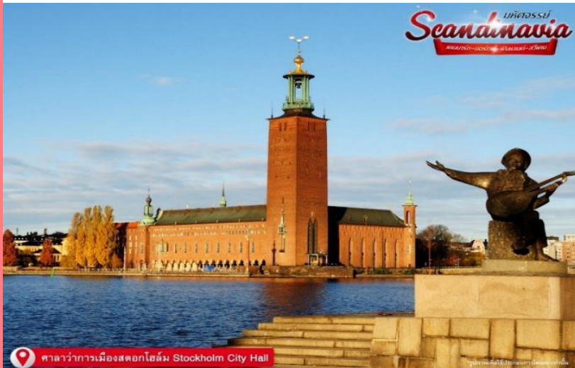
ศาลาว่าการเมืองสต็อกโฮล์ม Stockholm City Hall

เดินทางถึงท่าเรือ ณ กรุงสต็อกโฮล์ม (Stockholm) ประเทศสวีเดน นำท่านชม ศาลาว่าการเมืองสต็อกโฮล์ม (Stockholm City Hall) ศาลาว่าการ เมืองสต็อกโฮล์ม ใช้เวลาสร้างถึง 12 ปี