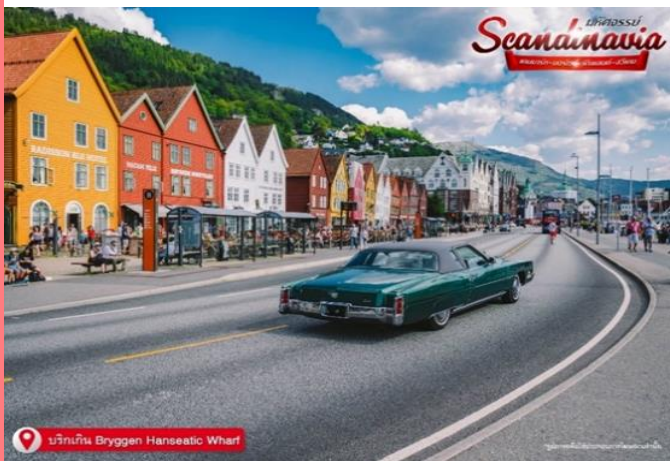
บริกเกิน Bryggen Hanseatic Wharf