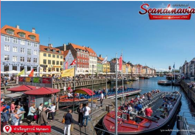
ท่าเรืออนุสาวรีย์ Nyhavn

เดินทางสู่ ท่าเรืออนุสาวรีย์ (Nyhavn) เป็นเขตท่าเรืออันเก่าแก่ของโคเปนเฮเกน ตั้งอยู่ริมฝั่งตะวันออกของตัวเมือง ตามประวัติได้กล่าวไว้ว่า พระเจ้าเฟรเดอริกที่ 5 ทรงรับสั่งให้สร้างท่าเรือเล็กๆ ตัวเมืองหลวง เพื่อให้สะดวกต่อการขนย้ายสินค้า และใช้เป็นท่าเรือพาณิชย์สำหรับเรือจากทั่วทุกมุมโลกมาเทียบท่า ในวันอากาศดีๆ สามารถเลือกทานอาหารชมบรรยากาศชิลๆ