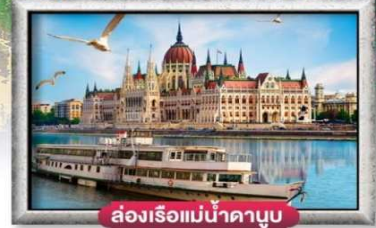
ส่องเรือแม่น้ำดานูบ

พิเศษ!! ลิ้มลองเมนูประจำชาติ ทั้ง 5 ประเทศ!!!