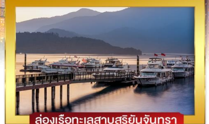
ล่องเรือทะเลสาบสุริยอันจินกรา

เดินทางโดยสายการบินไต้หวันแอร์ อาหาร : 6 มื้อ โรงแรม : 3 ดาว