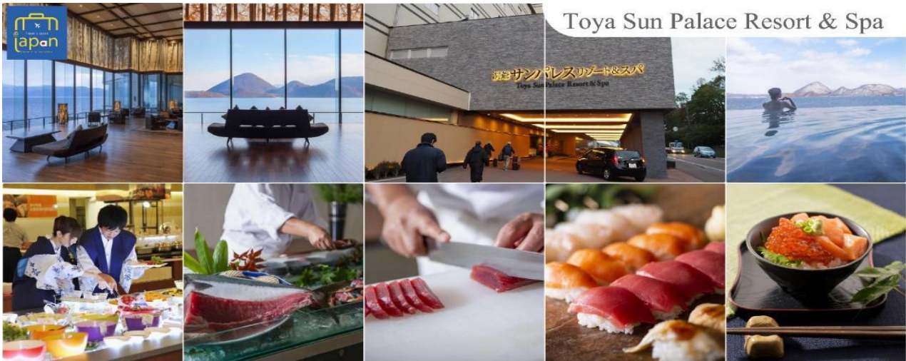
Toya Sun Palace Resort & Spa

TOYA SUN PALACE RESORT & SPA หรือเทียบเท่าระดับเดียวกัน