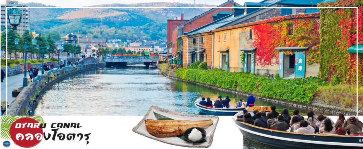
OTARU CANAL คลองโอตารุ

วันที่ห้า เมืองซัปโปโร – ดิวตี้ฟรี – เมืองโอตารุ – คลองโอตารุ – พิพิธภัณฑ์กล่องดนตรี – เมืองซัปโปโร – มหาวิทยาลัยซอกไกโด – ถนนช้อปปิ้งทานุกิโคจิ