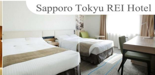
Sapporo Tokyu REI Hotel