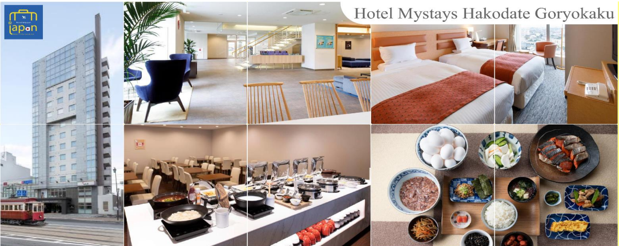
Hotel Mystays Hakodate Goryokaku

HOTEL MYSTAYS HAKODATE GORYOKAKU, HAKODATE หรือเทียบเท่าระดับเดียวกัน