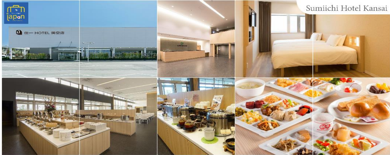
Sumiichi Hotel Kansai