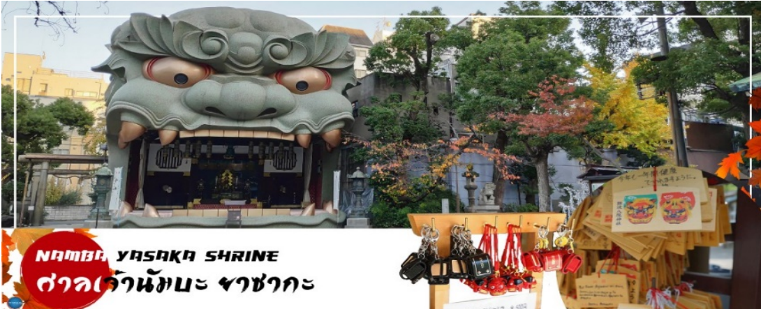
NAMBA YASAKA SHRINE ศาลเจ้านัมเมะ ยาซากะ

เที่ยง รับประทานอาหารกลางวัน ณ ภัตตาคาร (5)