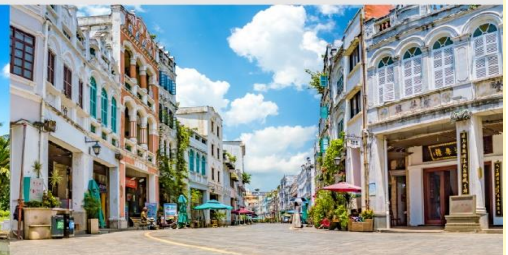
ถนนโบราณอีไหลว

*ทางบริษัทฯ ขอสงวนสิทธิ์ในการสลับโปรแกรมทัวร์ตามความเหมาะสมขึ้นอยู่กับสถานการณ์หน้างาน โดยคำนึงถึงผลประโยชน์ของลูกค้าเป็นสำคัญ