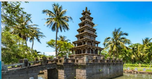
เจดีย์ 2 ชั้นนึ่งหม่ยหลาน