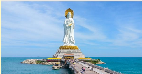
เจ้าแม่กวนอิมหนานชาน