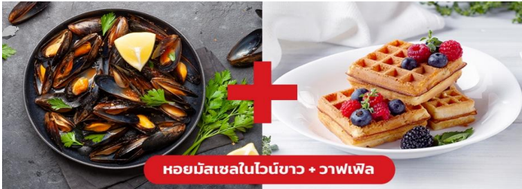
หอยมัสเซลในไวน์ขาว + วาฟเฟิล

🍴 รับประทานอาหารกลางวัน (มื้อที่10) เมนูพิเศษ!! หอยมัสเซล + วาฟเฟิล (Mussel in White wine + Waffle)