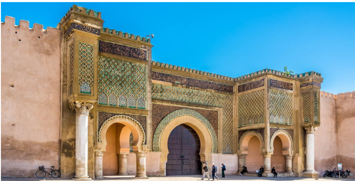
15 *ภาพใช้เพื่อการโฆษณาเท่านั้น*

นำท่านเดินทางสู่เมืองแมกเนส (MEKNES) เป็นเมืองหลวงโบราณในสมัยสุลต่าน มูเล อิสมาอิล (Mouley Ismail) แห่งราชวงศ์อะลาวิท (Alawite Dynasty) กษัตริย์จอมโหดผู้ชื่นชอบการทำสงครามใน ศ.ศ. ที่ 17 ด้วยเมืองแมกเนสมีทำเลที่ตั้งโดยมีแม่น้ำไหลผ่านกลางเมือง เมืองแมกเนสจึงเป็นเมืองศูนย์กลางการผลิตมะกอก ไวน์ และพืชพรรณต่างๆ มีกำแพงเมืองล้อมรอบเมืองเก่าที่ยาวประมาณ 40 กม. ซึ่งมีประตูเมือง