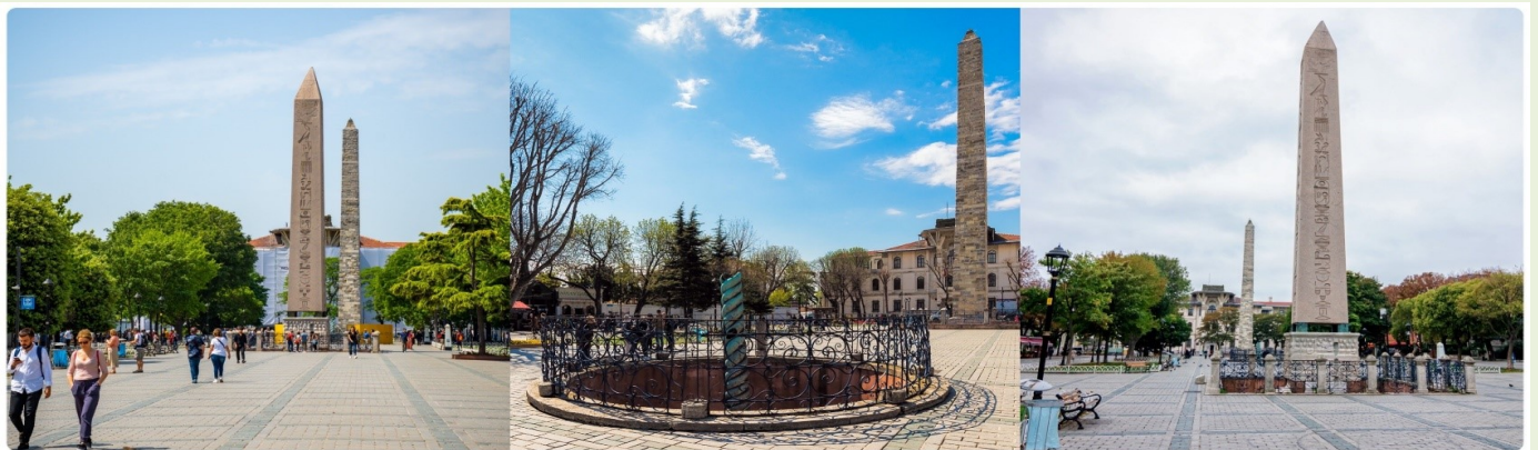
หน้า 13 (ภาพใช้เพื่อการโฆษณาเท่านั้น)

จากนั้นนำทุกท่านสู่ จัตุรัสสุลต่านอะห์เมตหรือฮิปโปโดรม (HIPPODROME) สนามแข่งม้าของชาวโรมัน จุดศูนย์กลางแห่งการท่องเที่ยวเมืองเก่า สร้างขึ้นในสมัยจักรพรรดิ เซปติมิอุสเซเวรุสเพื่อใช้เป็นที่แสดงกิจกรรมต่างๆของชาวเมือง ต่อมาในสมัยของจักรพรรดิคอนสแตนตินฮิปโปโดรมได้รับการขยายให้กว้างขึ้นตรงกลางเป็นที่ตั้งแสดงประติมากรรมต่าง ๆซึ่งส่วนใหญ่เป็นศิลปะในยุคกรีกโบราณในสมัยออตโตมันสถานที่แห่งนี้ใช้เป็นที่จัดงานพิธีแต่ในปัจจุบันเหลือเพียงพื้นที่ลานด้านหน้ามัสยิดสุลต่านอะห์เมตซึ่งเป็นที่ตั้งของเสาโอเบ