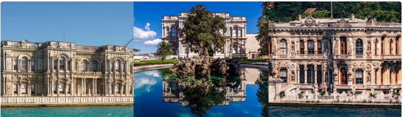
หน้า 14 (ภาพใช้เพื่อการโฆษณาเท่านั้น)

จากนั้นนำท่านชม พระราชวังเบลเลอเบย์ (BEYLERBEYI PALACE) เป็นพระราชวังที่ตั้งอยู่ริมฝั่งทะเล ของช่องแคบบอสฟอรัสในฝั่งเอเชีย ใกล้กับสะพานข้ามช่องแคบฯ แห่งแรก ถือเป็นพระราชวังฤดูร้อน