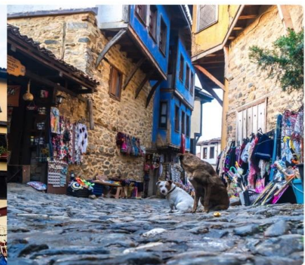
หน้า 15 (ภาพใช้เพื่อการโฆษณาเท่านั้น)