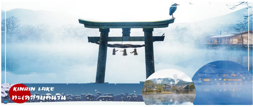
KIRIN LAKE ทะเลสาบคิริน

นำท่านสู่ บ่อนรกเบปปุ จิโกคุ เมกุริ (Beppu Jigoku Meguri Or Hell Tour) หรือบ่อน้ำพุร้อน ขุนมรกตทั้งแปด เป็นบ่อน้ำพุร้อนธรรมชาติที่เกิดขึ้น ภายหลังจากการระเบิดของภูเขาไฟ ประกอบไปด้วยแร่ธาตุที่เข้มข้น เช่น กำมะถัน แร่เหล็ก โซเดียม คาร์บอเนต เรเดียม เป็นต้น และร้อนเกินกว่าจะลงไปอาบได้ แล้วบ่อทั้ง 8 บ่อ ก็ตั้งชื่อให้แปลกตามลักษณะภายนอกที่เห็น (ให้ท่านเข้าชม 2 บ่อ) นำท่านสู่ เมืองยูฟูอิน (Yufuin) เมืองเล็กๆ ในจังหวัดโออิตะ (Oita) ที่รู้จักกันดีในฐานะแหล่งออนเซ็นชื่อดัง และที่นี่ก็เต็มไปด้วยสถานที่น่ารักๆ มีถนนที่เรียงรายไปด้วยคาเฟ่และร้านขายของเก๋ๆ ของกระจุกกระจิกมากมาย ระหว่างทางไม่ควรพลาดที่จะแวะ ยูฟูอินฟลอรัลวิลเลจ (Yufuin Floral Village) ฮิมปาร์คในบรรยากาศแห่งเทพนิยายที่ดูราวกับกำลังหลงเข้าไปในเหมือนจำลองหมู่บ้านสโตนโรโร ร้านค้าทุกหลังเป็นสีเหลืองที่มีแต่ร้านที่มีสินค้าเป็นเอกลักษณ์ !!!ไฮไลท์ ประจำเมืองยูฟูอิน บ้านอิฐที่แสนคลาสสิกเรียงรายอยู่บนถนนสายเล็กๆ ประดับประดาไปด้วยดอกไม้บานาชนิด ภายในหมู่บ้านมีถนนช้อปปิ้ง มีร้านรวงต่างๆ ที่ตกแต่งได้อย่างน่ารัก ร้านไอศกรีม หรือ คาเฟ่ต่างๆ อย่าง Alice Tea คาเฟ่สุดชิคบรรยากาศเหมือนอยู่ในป่าและจับน้ำชากับ Mad Hatter หรือจะเป็นร้านขนม ที่มีเค้กวาดมาจาก Kiki's Delivery Service กลิ่นหอมของขนมปังอบอวล นากินสุดๆ นอกจากนี้ยังมี จุดพักผ่อนให้ผ่อนคลายให้อีกมากมาย เดินเลยจากถนนช้อปปิ้งไปท่านจะได้พบความงามของ ทะเลสาบคิริน (Kirin Lake) น้ำทะเลสาบใสเห็นตัวปลาแหวกว่ายในผืนน้ำ บางช่วงมีหมอกบางๆ ลง นับว่าคุ้มค่ากับการมาเห็นความงามนี้ด้วยตาตัวเองสักครั้งนึงอย่างแน่นอน อิสระให้ท่านเดินเล่นและถ่ายรูปตามอัธยาศัย