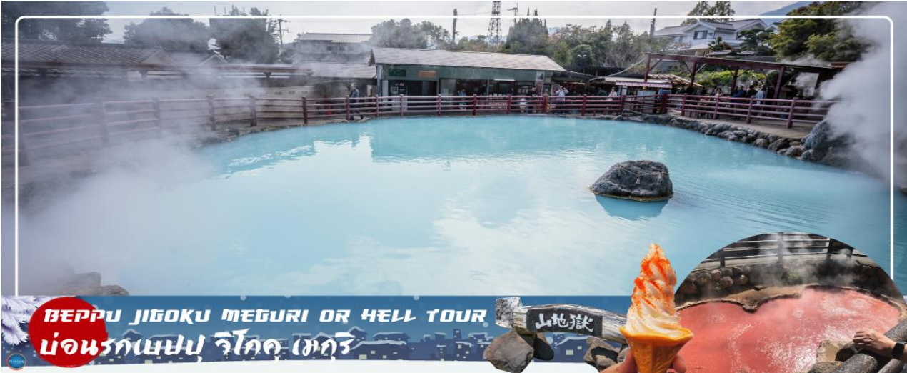
BEPPU JIGOKU MEGURI OR HELL TOUR บ่อนรกเบปปุ จิโกคุ เมกุริ

วันที่สาม เมืองเบปปุ – บ่อนรกเบปปุ จิโกคุ เมกุริ (เข้าชม 2 บ่อ) – เมืองยูฟูอิน – หมู่บ้านยูฟูอินฟลอรัล – ทะเลสาบคิริน – เมืองฟุกุโอกะ – วัดนันโซอิน – ดิวตี้ฟรี – กันดั้ม ปาร์ค ฟุกุโอกะ