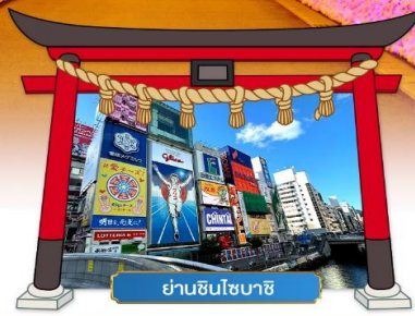
ย่านชินโซบาชิ