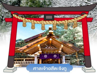
ศาลเจ้าอัสึเตะจิงกู