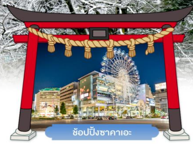
ซ็อบบิงซาคาเอะ