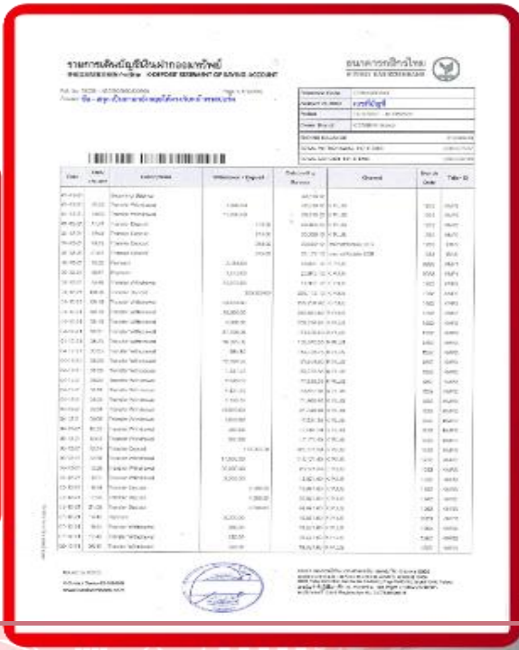
ตัวอย่าง Bank Statement ที่ผู้สมัครต้องขอจากธนาคาร

3.4 ปรับสมุดบัญชีธนาคารตัวจริง และเตรียมไปในวันที่ยื่นวีซ่า