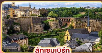
ลักเซมเบิร์ก