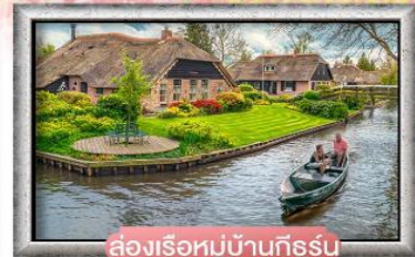
ส่องเรือหมู่บ้านทีรูร์น