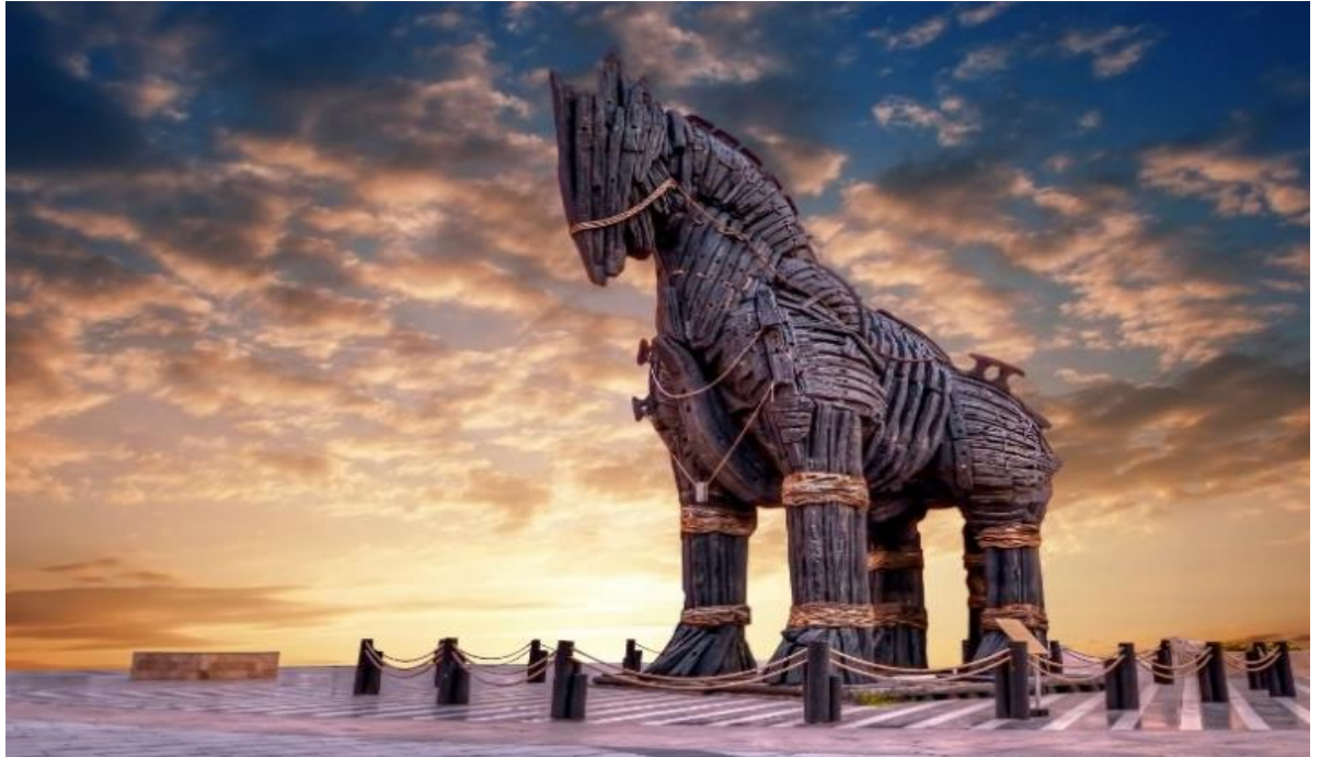
นำท่านชมและถ่ายภาพ ม้าไม้จำลองเมืองทรอยริมทะเล (TROJAN STATUE/HOLLYWOOD HORSE) เป็นม้าไม้ที่มีชื่อเสียงโด่งดังมากที่สุดจากมหากาพย์ภาพยนตร์ฮอลลีวูดเรื่อง ทรอย (Troy) ในปี 2004 มีแบรด