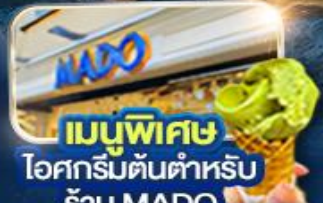
เมนูพิเศษ ไอศกรีมต้นตำหรับ ร้าน MADO