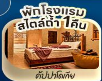
พักโรงแรม สไตล์ดี 1 คืน