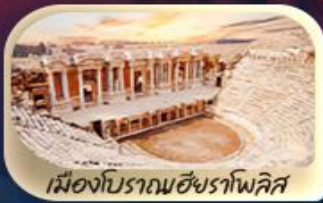
เมืองโบราณเฮียราโพลิส