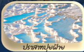
ปราสาทปุยฝ้าย