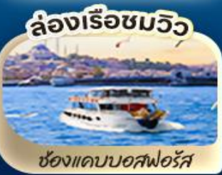
ล่องเรือชมวิว