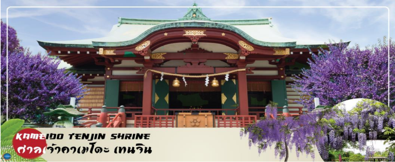
KAMEIDO TENJIN SHRINE ศาลเจ้าคาเมโตะ เทนจิน

วันที่สี่ กรุงโตเกียว – ศาลเจ้าคาเมโตะ เทนจิน (จุดชมดอกวิสทีเรียขึ้นอยู่กับสภาพอากาศ) – โทโยสุ เซนเคียวคิ บันไร – ชมแมวยักษ์ 3 มิติ พร้อมช้อปปิ้งย่านชินจูกุ – เมืองนาริยะ