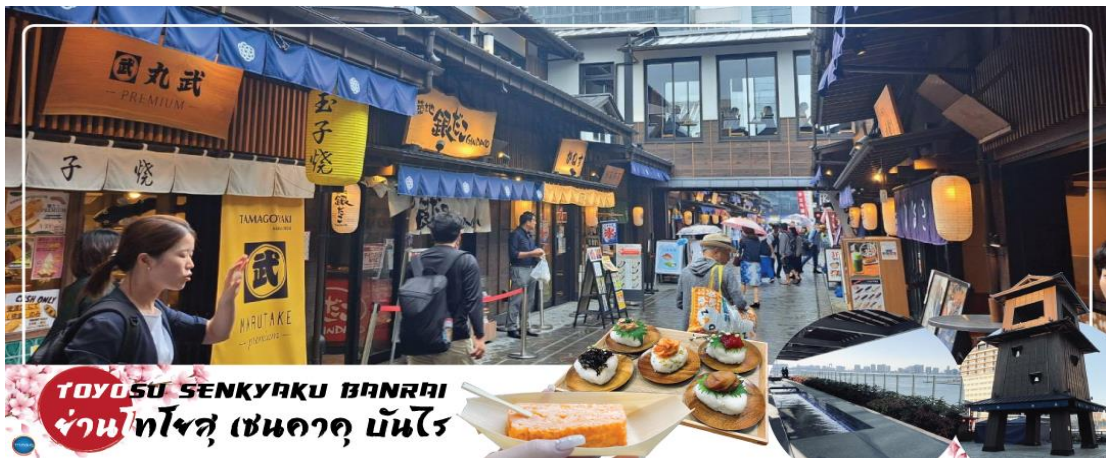
TOYOSU SENKYAKU BANRAI ย่านโทโยสุ เซนคาคุ บันไร

จากนั้นนำท่านสู่ ย่านโทโยสุ เซนคาคุ บันไร (Toyosu Senkyaku Banrai) (ใช้เวลาเดินทางประมาณ 30 นาที) เป็นสถานที่ท่องเที่ยวใหม่ที่ตั้งอยู่ในย่าน Toyosu ของ Tokyo ที่เป็นเหมือนตลาดในสมัยยุคสมัยเอโดะ เปิดให้บริการในวันที่ 1 กุมภาพันธ์ 2024 โดยมีทั้งตลาด อาหาร และสถาบันเท็ง นอกจากนี้ยังมีออนเซ็น 24 ชั่วโมงที่ช่วยให้เราผ่อนคลายอีกด้วย เป็นตลาดที่มีทั้งอาหารทะเลสดใหม่จาก Toyosu Market และอาหารญี่ปุ่นหลากหลายชนิด เช่น ซูชิ เทมปุระ และราเมน ที่นี่มีร้านค้าจำนวนมากที่ขายของที่ระลึกและวัตถุดิบตามฤดูกาล นอกจากนี้ยังมีจุดออนเซ็นแช่เท้า (ฟรี) ที่ยังชมบรรยากาศของโตเกียวได้อีกด้วย