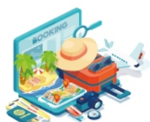
Yukari No Mori Fujikawaguchiko