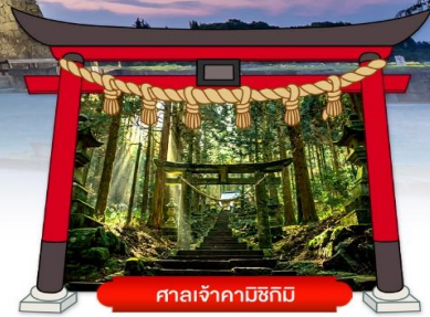
ศาลเจ้าคามิชิคิมิ