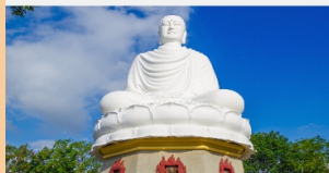
วัดลองเซิน