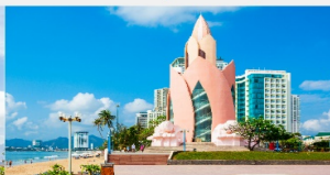
Tram Huong Tower