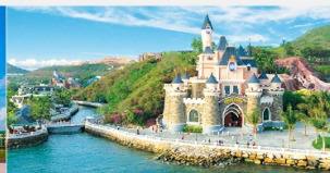
สวนสนุกวันเดอร์ส

*ทางบริษัทฯ ขอสงวนสิทธิ์ในการสลับโปรแกรมทัวร์ตามความเหมาะสมขึ้นอยู่กับสถานการณ์หน้างาน โดยคำนึงถึงผลประโยชน์ของลูกค้าเป็นสำคัญ