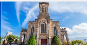
โบสถ์หินญาจาง