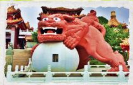
วัดเขวียนซวู