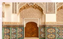
Ben Youssef Medersa