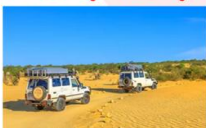
ทะเลทรายซาฮารา

** พักที่ Zahra luxury Desert Camp 4* หรือเทียบเท่า **