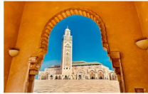
สุเหร่าแห่งกษัตริย์ฮัสซันที่ 2

06.10 น. เดินทางถึงสนามบินอิสตันบูล แวะเปลี่ยนเครื่อง 11.50 น. ออกเดินทางสู่นครคาซาบลังกา เที่ยวบิน TK617 14.50 น. เดินทางถึงสนามบินคาซาบลังกา ประเทศโมร็อกโก