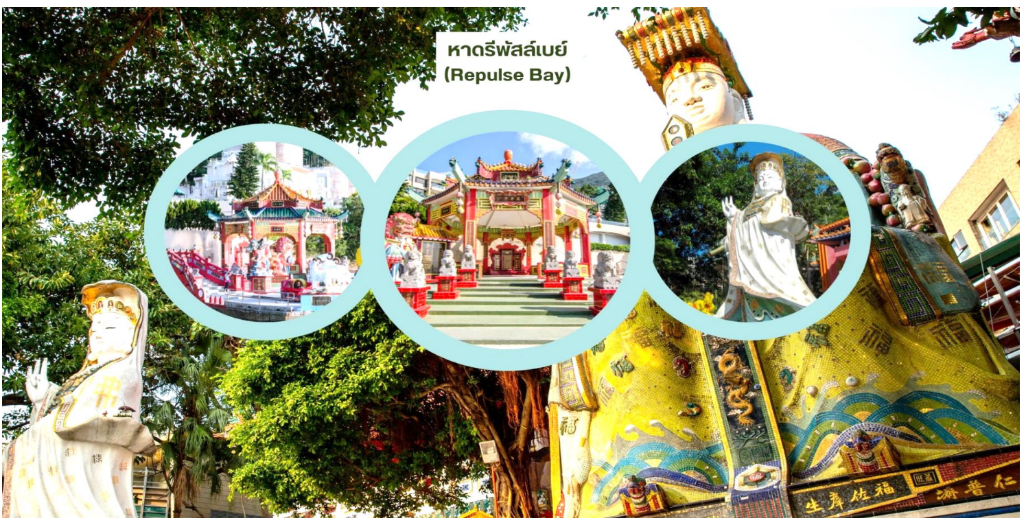
หาดรีพัลส์เบย์ (Repulse Bay)

นำท่านเดินทางสู่ หาดรีพัลส์เบย์ (Repulse Bay) นำท่านขอพรเจ้าแม่กวนอิม หนึ่งในเทพที่ชาวฮ่องกงให้ความเคารพนับถืออย่างมาก ไม่ว่าจะขอพรสิ่งใดก็จะสมความปรารถนาทั้งสิ้น เริ่มต้นด้วยการ เดินเข้าวัดด้วยเท้าซ้าย และออกด้วยเท้าขวา เป็นเคล็ดลับที่ชาวฮ่องกง และคนจีนบอกว่าคุณคล้ายกับการเดินของเข็มนาฬิกา ซึ่งจะทำให้ชีวิตเจริญก้าวหน้าขึ้นเอง ก่อนที่จะเดินเข้าวัดให้แวะเสริมดวงแห่งโชคลาภได้ด้วยการ ลูบลูกแก้วในปากสิงโต ด้านหน้าวัด เพื่อให้มีแต่ความโชคดี หากเดินทางเข้ามาภายในวัดแล้วด้านซ้ายมือ จะเป็นที่ประดิษฐานเจ้าแม่กวนอิม และด้านขวามือ จะเป็นที่ประดิษฐานเจ้าแม่ทับทิม หรือเจ้าแม่ทिनเห่า เชื่อว่าเป็นเทพแห่งท้องทะเลที่คอยปกป้องรักษาชาวประมงและยังเป็นเทพแห่งโชคลาภ สามารถขอพรกับเจ้าแม่กวนอิมปางประทานพร, ขอพร