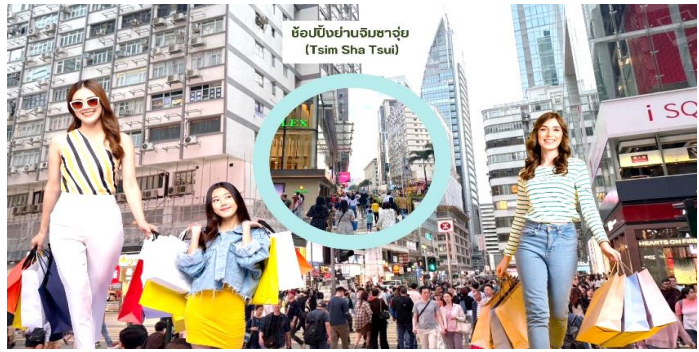
ช้อปปิ้งย่านจิมซาจуй (Tsim Sha Tsui)

จากนั้นอิสระให้ท่านเต็มอิ่มกับการ ช้อปปิ้งย่านจิมซาจуй (Tsim Sha Tsui) มักจะตั้งต้นกันที่สถานีจิมซาจуй มีร้านขายของทั้งเครื่องหนัง, เครื่องกีฬา, เครื่องใช้ไฟฟ้า, กล้องถ่ายรูป ฯลฯ และสินค้าแบบที่เป็นของพื้นเมืองฮ่องกงอยู่ด้วยและตามชอปปิงคอมเพล็กซ์จิมซาจуйมี Shopping Complex ขนาดใหญ่ ชื่อ Ocean Terminal ซึ่งประกอบไปด้วยห้างสรรพสินค้าเรียงรายกันอยู่ และมีทางเชื่อมติดต่อกันสามารถเดินทะลุถึงกันได้ ให้แบรนด์ดังมากมายให้ท่านได้เลือกซื้อ ไม่ว่าจะเป็น Coach, Longchamp, Louis Vuitton, Hemes, Prada, Giordano, Bossini และอีกมากมาย