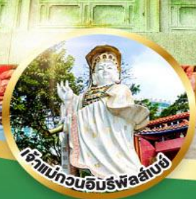
เจ้าแม่กวนอิมรับพร