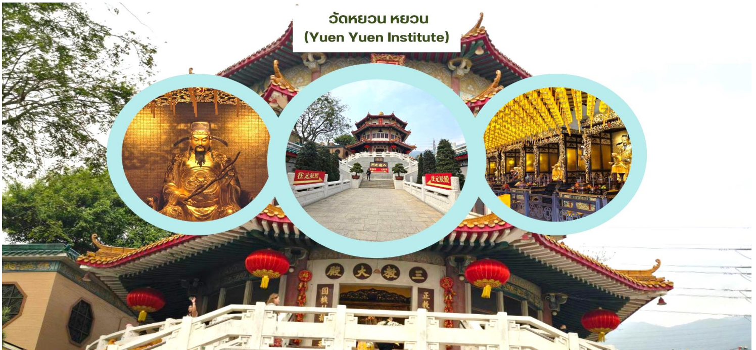
วัดหยวน หยวน (Yuen Yuen Institute)

จากนั้นนำท่านเดินทางสู่ วัดหยวน หยวน (Yuen Yuen Institute) เน้นด้านเสริมดวงต่อชะตา ขอพร ไท่ส่วยเอี้ย เทพเจ้าผู้คุ้มครองดวงชะตาซึ่งเป็นเทพเจ้าที่เป็นที่ยอมรับนับถือกันมากที่สุดของลัทธิเต๋า วัดหยวน หยวน จุดเด่นของวัดอยู่ที่ วิหารสวรรค์ หรือ หอฟ้า อาคารรูปทรง 6 เหลี่ยม สร้างขึ้นตามแบบของหอฟ้าเทียนถานของเมืองปักกิ่งประเทศจีน วัดแห่งนี้สร้างตามหลักฮวงจุ้ย โดยด้านหลังมีภูเขา เพื่อรับพลังมังกรจากภูเขาด้านหลังด้านซ้ายขวาโอบล้อมด้วยมังกรเขียว เสือขาว