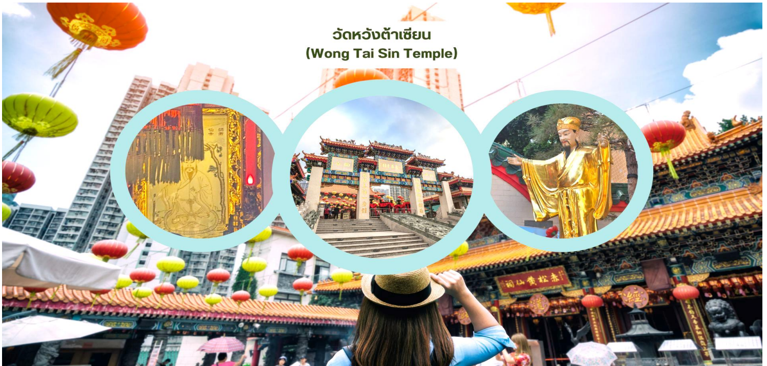
วัดหวังต้าเซียน (Wong Tai Sin Temple)

รับประทานอาหารเช้า ณ ภัตตาคาร บริการท่านด้วยเมนูติ่มซำฮ่องกง (มื้อที่ 2)