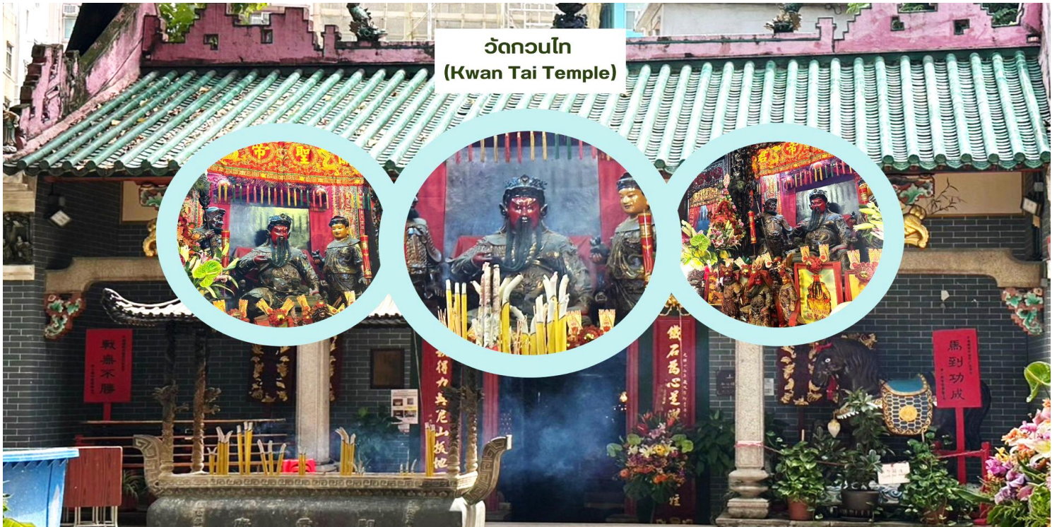
วัดกวนไท (Kwan Tai Temple)

จากนั้นนำท่านเดินทางสู่ วัดกวนไท (Kwan Tai Temple) สร้างขึ้นในปี 1891 เพื่อบูชาเทพเจ้ากวนอู ซึ่งเป็นเทพเจ้าแห่งความซื่อสัตย์ และเปี่ยมไปด้วยคุณธรรม ภายในวัดมีรูปปั้นกวนอูขนาดใหญ่ตั้งอยู่ที่แท่นบูชา มีผู้คนจำนวนมากมาสักการะท่านกวนอูเพื่อขอพรให้ประสบความสำเร็จในธุรกิจ เรื่องความโชคดี โชคลาภ การค้าขาย และการปกป้องคุ้มครอง