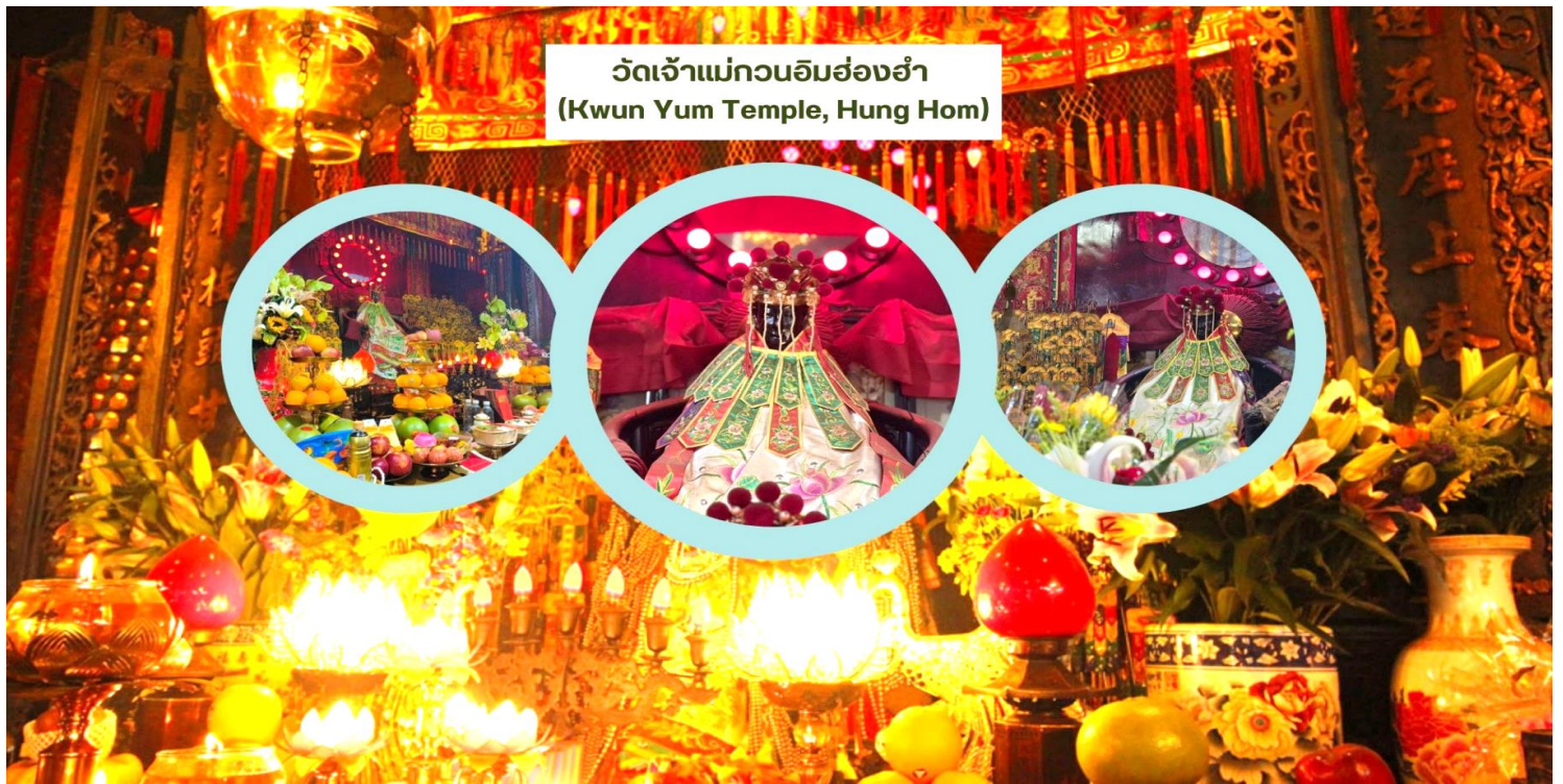
วัดเจ้าแม่กวนอิมฮ่องกง (Kwun Yum Temple, Hung Hom)

นำท่านเดินทางสู่ วัดเจ้าแม่กวนอิมฮ่องกง (Kwun Yum Temple, Hung Hom) เป็นวัดเล็กๆ อันเก่าแก่ ถูกสร้างมาตั้งแต่ปี พ.ศ. 2416 วัดนี้เคยมีปาฏิหาริย์เกิดขึ้น เมื่อช่วงสงครามโลกครั้งที่ 2 มีการปล่อยระเบิดลง