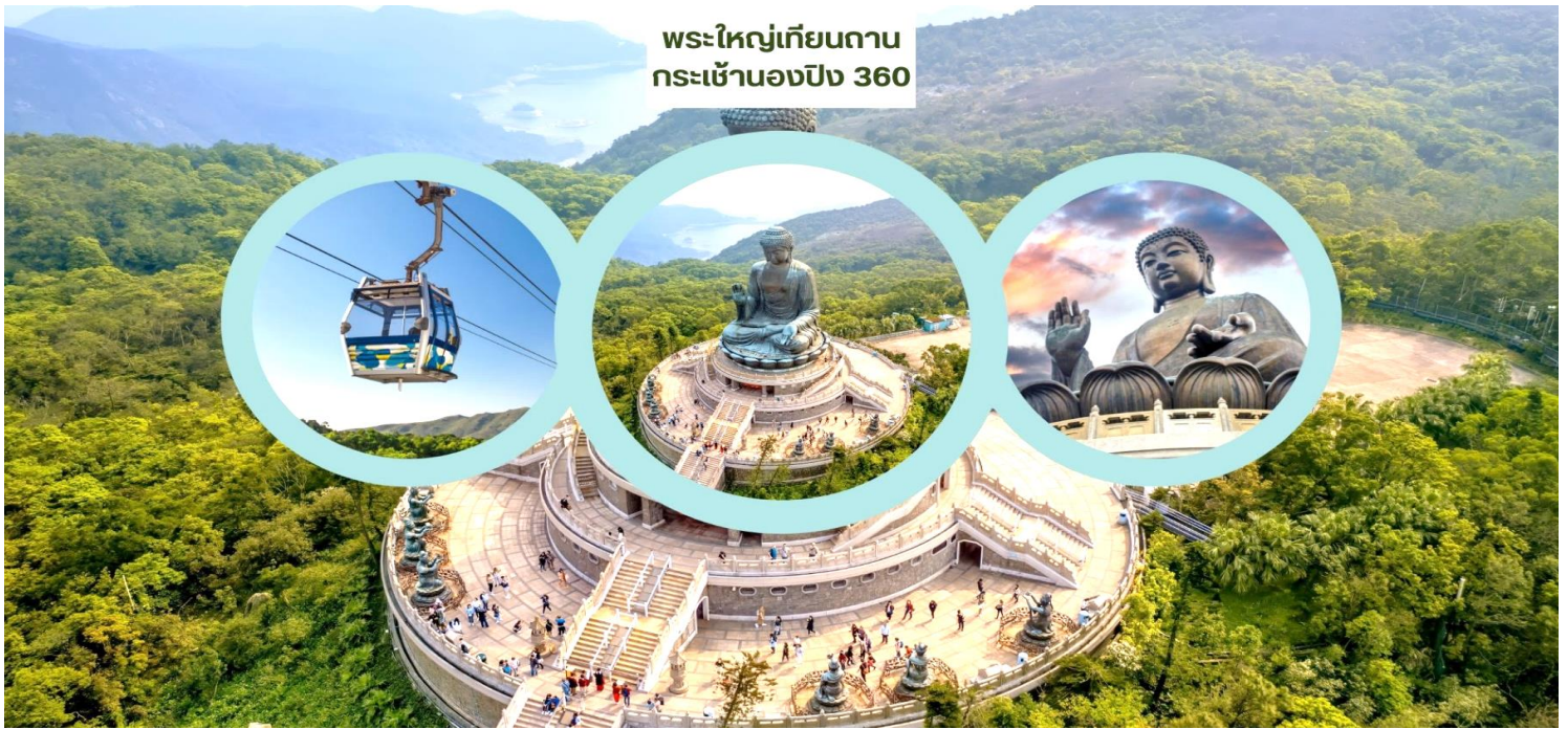
พระใหญ่เทียนถาน กระเช้าองปิง 360

จากนั้นนำท่านเดินทางสู่ เกาะลันเตา สถานีตงซุง นำท่าน ขึ้นกระเช้าองปิง 360 (Ngong Ping 360) ชมวิวมุมกว้าง 360 องศา รวมค่ากระเช้า ตลอดระยะทางทั้งหมด 5.7 กิโลเมตร (ในกรณีที่กระเช้าองปิงปิด ทางบริษัทฯ ขอสงวนสิทธิ์นำท่านขึ้นชมโดยรถบัสแทน) นำท่านสักการะขอพร พระใหญ่เทียนถาน หรือ พระใหญ่เกาะลันเตา ณ ลานอธิษฐาน พระพุทธรูปทองสัมฤทธิ์อันศักดิ์สิทธิ์ของฮ่องกง และเป็นพระพุทธรูปกลางแจ้งใหญ่ที่สุดในโลกองค์พระทำขึ้นจากการเชื่อมแผ่นทองสัมฤทธิ์กว่า 200 แผ่นเข้าด้วยกันหันพระพักตร์ไปทางด้านทะเลจีนใต้และมองอย่างสงบลงมายังหุบเขา และโขดหินเบื้องล่าง ให้ท่านชมความงดงามตามอัธยาศัย