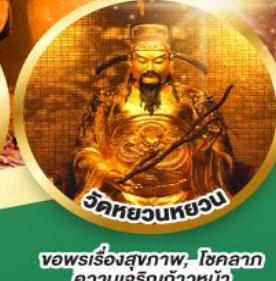
วัดหยวนหยวน

ขอพรเรื่องสุขภาพ, โชคลาภ ความเจริญก้าวหน้า