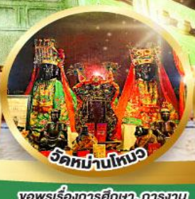
วัดม่านโถง

ขอพรเรื่องการศึกษา, การงาน สติปัญญาและความกล้าหาญ