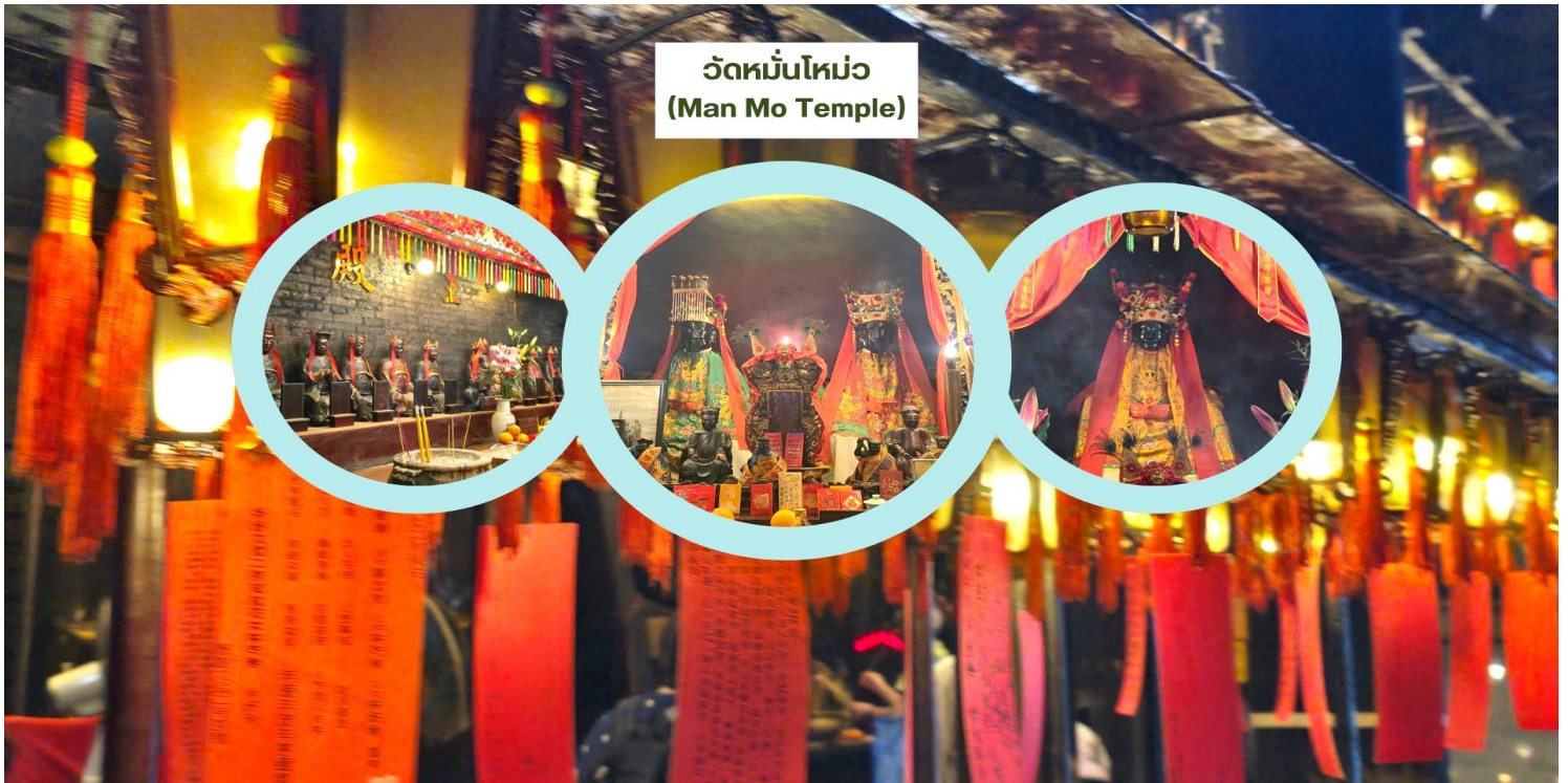
วัดหมั่นโหม่ว (Man Mo Temple)

นำท่านเดินทางสู่ วัดหมั่นโหม่ว (Man Mo Temple) วัดเก่าแก่และใหญ่ที่สุดในบรรดาวัดหมั่นโหม่วทั้งหมดของฮ่องกง ตั้งอยู่ในย่าน Sheung Wan ขึ้นชื่อในเรื่องการขอพรด้านการเรียน ภายในวิหารโดดเด่นด้วยชุดรูปแว่นตัดกับฉากหลังสีแดง-ทองอันสง่างาม สร้างขึ้นเพื่อสักการะ เทพเจ้าหมั่นโตกวัน (Man) เทพแห่งการเรียนรู้ (ด้านบู้) และ เทพเจ้าโหม่วโตกวัน (Mo) หรือ เทพกวนอู เทพแห่งสงคราม (ด้านบู๊) บรรยายกาศภายในวัดงดงามและแฝงด้วยความศักดิ์สิทธิ์เหนือธรรมชาติ