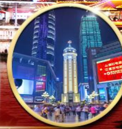
ถนนคนเดินเจียงฟางเป่ย์