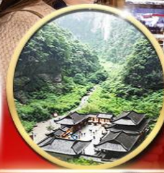
อุทยานหลุมฟ้า สะพาน สวรรค์