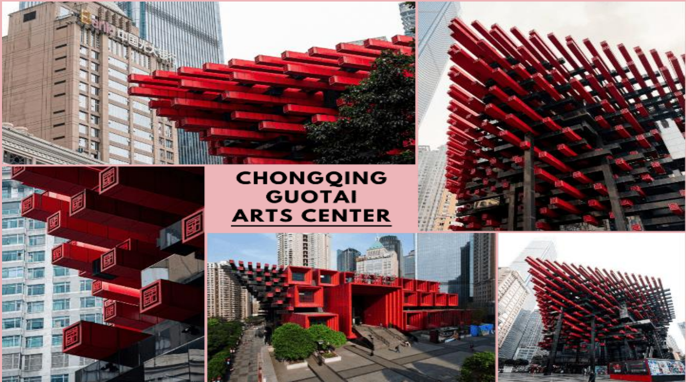
CHONGQING GUOTAI ARTS CENTER

จากนั้นนำท่านสู่ ติ๊กตะเกียบ (Chongqing Guotai Arts Center) แลนด์มาร์กดีไซน์ล้ำสมัย เป็นสิ่งก่อสร้างอันมีเอกลักษณ์ อาคารนี้ถูกออกแบบให้มีรูปร่างคล้ายกอง “ตะเกียบยักษ์” สีดำ และแดงที่วางซ้อนกันเป็นชั้น ๆ สร้างความประทับใจให้กับผู้พบเห็นตั้งแต่แรกเห็น นอกจากนี้จะเป็นสัญลักษณ์ที่โดดเด่นแล้ว ยังเป็นศูนย์รวมงานศิลปะที่สำคัญ มีการจัดแสดงนิทรรศการศิลปะหลากหลายประเภท ทั้งภาพวาด ประติมากรรม และการแสดงต่าง ๆ สะท้อนถึงความคิดสร้างสรรค์ และการผสมผสานระหว่างวัฒนธรรมจีนดั้งเดิมกับความทันสมัยได้อย่างลงตัว ติ๊กตะเกียบจึงเป็นสัญลักษณ์แห่งความภาคภูมิใจ ความเป็นเอกลักษณ์ของเมืองจงชิ่งที่น่ามาเยือน และชื่นชมอย่างยิ่ง