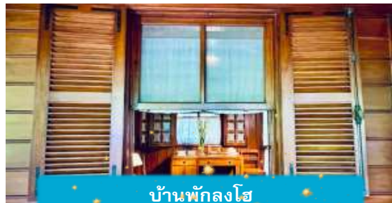
บ้านพักลุงโฮ