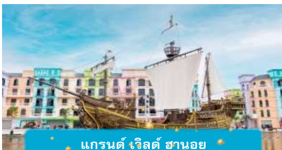
แกรนด์ เวิลด์ ซานออย