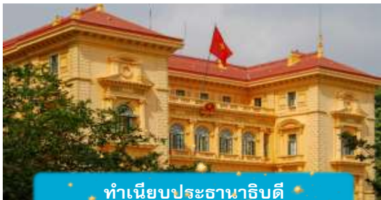
ทำเนียบประธานาธิบดี