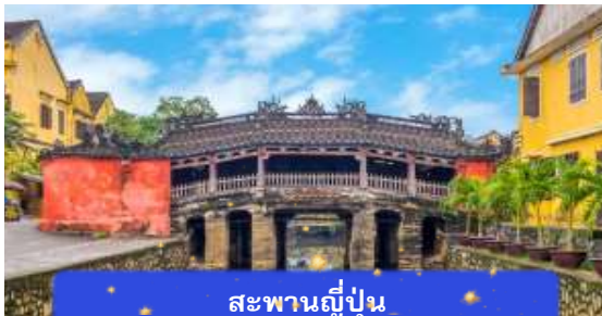
สะพานญี่ปุ่น

จากนั้นนำท่านเดินทางสู่ เมืองโบราณฮอยอัน เมืองมรดกโลกที่ยังคงเอกลักษณ์และรักษาวัฒนธรรมไว้อย่างดีเยี่ยม โดยท่านสามารถเดินเล่น ถ่ายรูป ตามตรอกซอกซอยต่างๆ ได้ ไฮไลท์ของการมาถ่ายรูปเช็คอินที่นี่คือการได้ขึ้นไปถ่ายรูปจากมุมสูงของคาเฟ่ที่อยู่ตามซอกซอย นำท่านชม สะพานญี่ปุ่น สะพานแห่งมิตรไมตรี ที่ได้ชื่อนี้เนื่องจากสะพานแห่งนี้สร้างขึ้นโดยชุมชนชาวญี่ปุ่น เป็นสะพานที่สร้างขึ้นข้ามคลองที่ในอดีต 400 ปีกว่าที่ผ่านมา