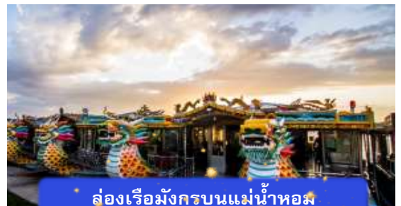
ล่องเรือมังกรบนแม่น้ำหอม

ที่พัก THANH BINH HOTEL ระดับ 4 ดาวมาตรฐานท้องถิ่น หรือเทียบเท่า