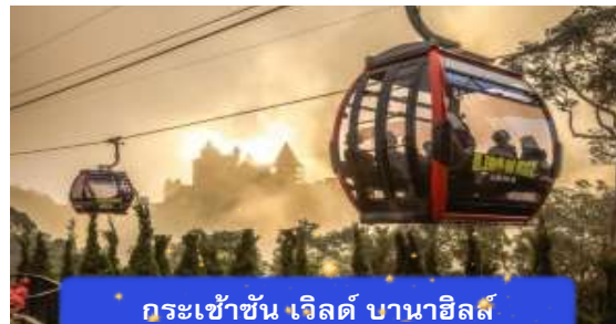
กระเช้าขึ้น เวิลด์ บานาฮิลล์