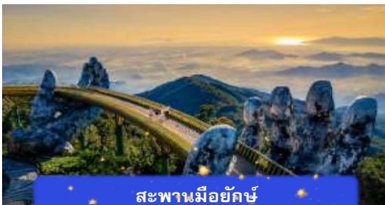
สะพานมียักษ์

เที่ยง อิสระอาหารกลางวันเพื่อความสะดวกในการท่องเที่ยว